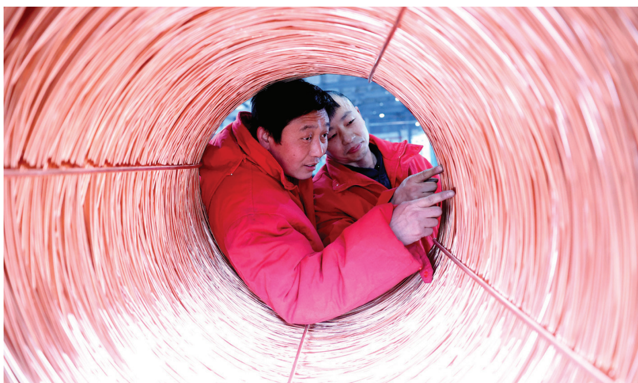
昌吉市新疆如意交联电缆制造有限公司生产车间内,工人在电缆生产线上忙碌。