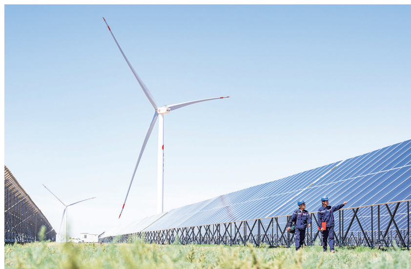
木垒县四十个井子风电规划区,昌吉州国投50万千瓦风光储同场项目的运维人员在巡检。 □本报记者 何龙摄