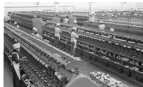
1985年,昌吉棉纺织厂建成,是当时全疆首屈一指的棉纺龙头企业。 资料图片