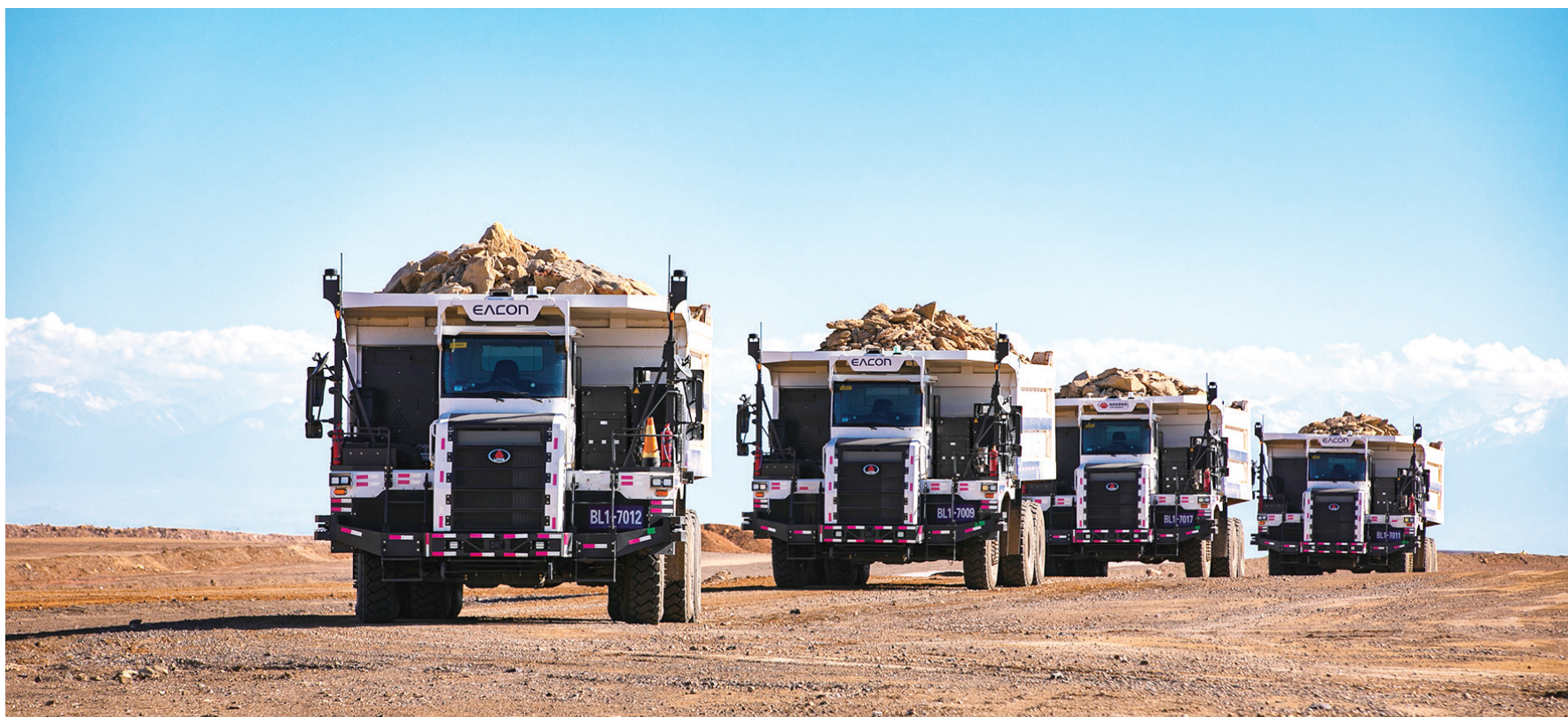
准东经济技术开发区国家能源集团准东露天煤矿,无人驾驶矿卡正在作业。