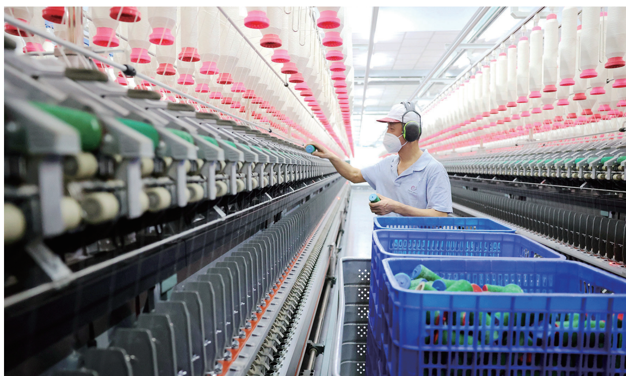
昌吉溢达纺织有限公司,工人在智能车间纺纱作业。