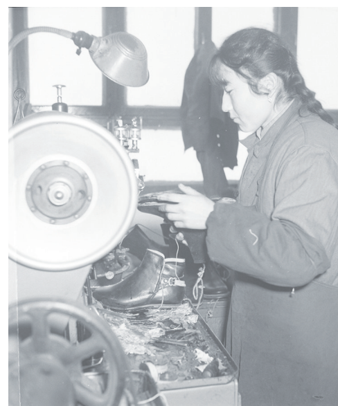
1990年的乡镇皮革厂。 资料图片