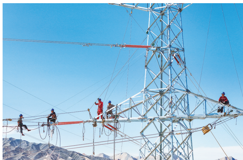
呼图壁县雀尔沟220千伏输变电工程施工现场,工人在进行塔上作业。