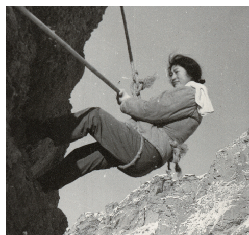
1971年11月,建设者不畏艰险、不怕严寒,修建三屯河水库。

这里有新疆工业的摇篮,有全国最大的整装煤田,有全球输变电制造领军企业。70时光里,昌吉州工业开拓奋进、砥砺前行,与国家经济紧密相连、相融共生。从车间到产品,从工厂到产业园,从产业链低端到中高端,从“昌吉制造”到“昌吉智造”;从量的厚积到质的飞跃,从结构优化到效益提升,从体系完善到集聚效应凸显……昌吉州工业发展气势如虹。如今,这片土地正以前所未有的速度向前发展,成为发展、创新的代名词,绿色、蓬勃的栖息地,时代、未来的发展地。