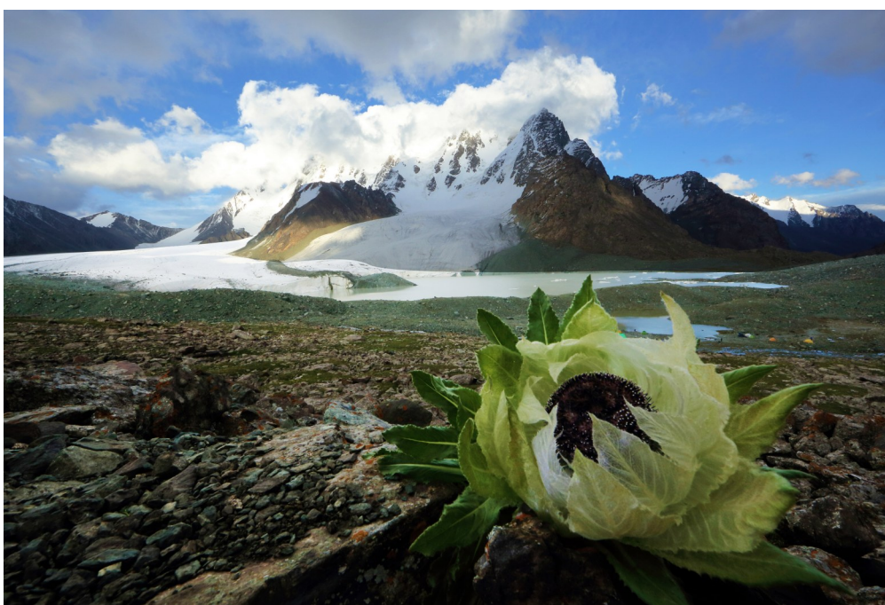
《天山雪莲盛开在博格达峰下》

作品《天山雪莲盛开在博格达峰下》获“‘美丽中国，我是行动者’提升公民生态文明意识行动计划”生态环境保护主题摄影作品三等奖。