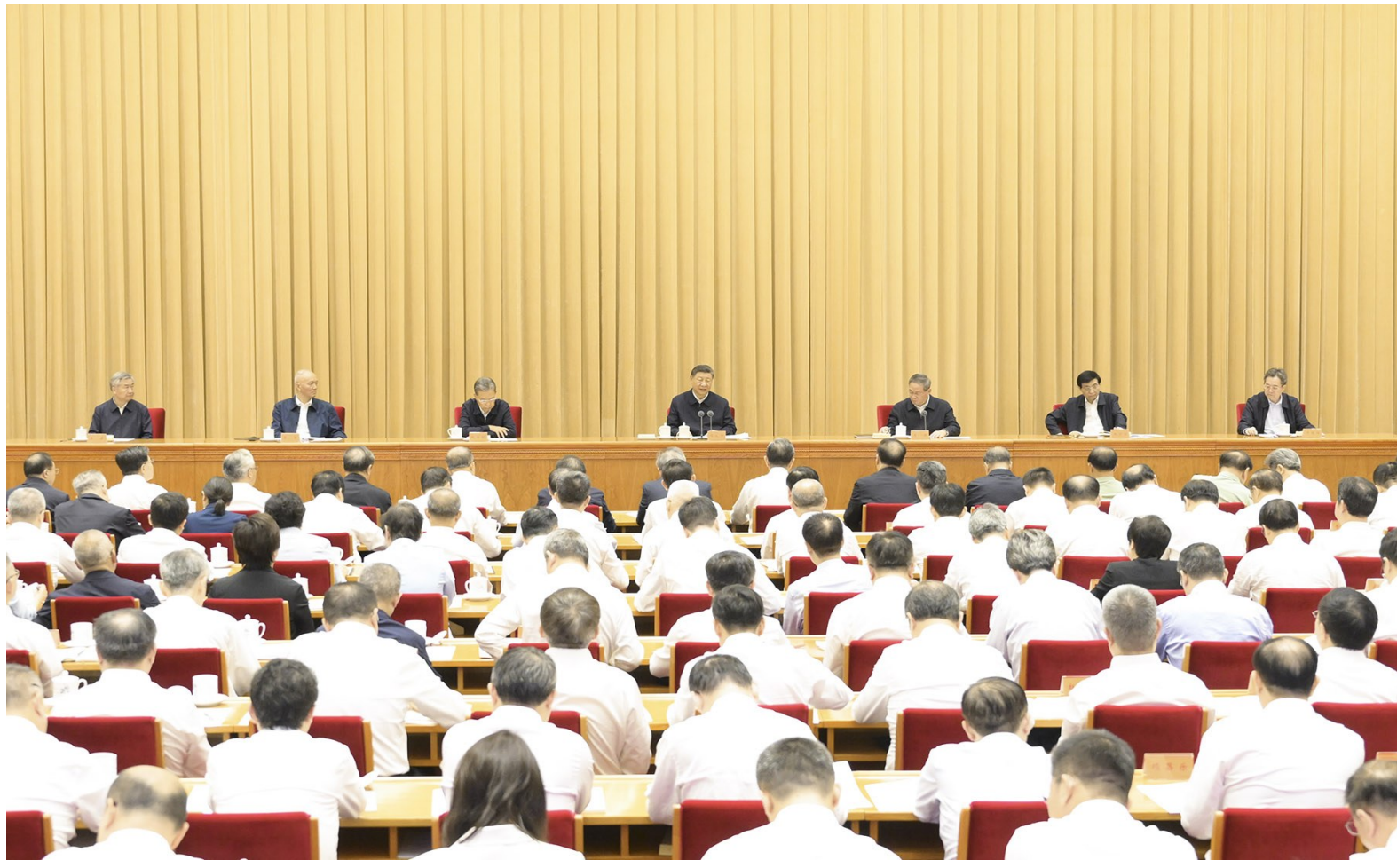
9月9日至10日，全国教育大会在北京召开。中共中央总书记、国家主席、中央军委主席习近平出席会议并发表重要讲话。李强、赵乐际、王沪宁、蔡奇、丁薛祥、李希出席会议。

新华社北京9月10日电 全国教育大会9日至10日在北京召开。中共中央总书记、国家主席、中央军委主席习近平出席大会并发表重要讲话。他强调，建成教育强国是近代以来中华民族梦寐以求的美好愿望，是实现以中国式现代化全面推进强国建设、民族复兴伟业的先导任务、坚实基础、战略支撑，必须朝着既定目标扎实迈进。