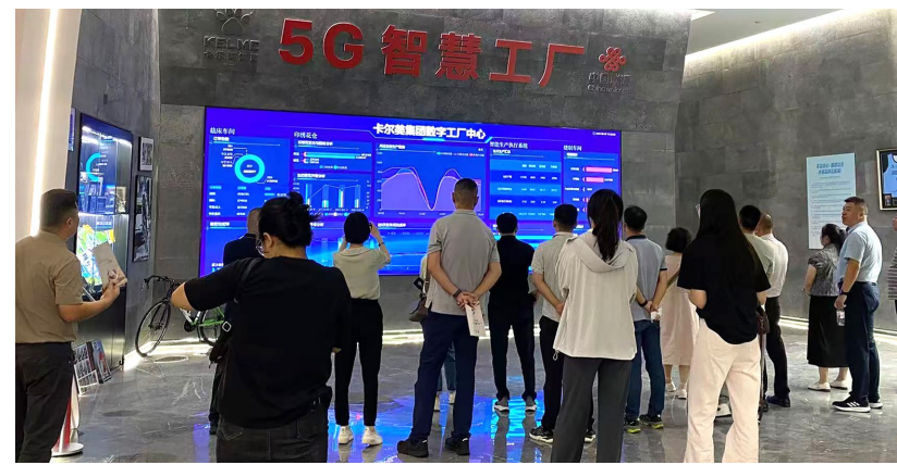
图为专题培训班学员在福建企业实地参观学习。