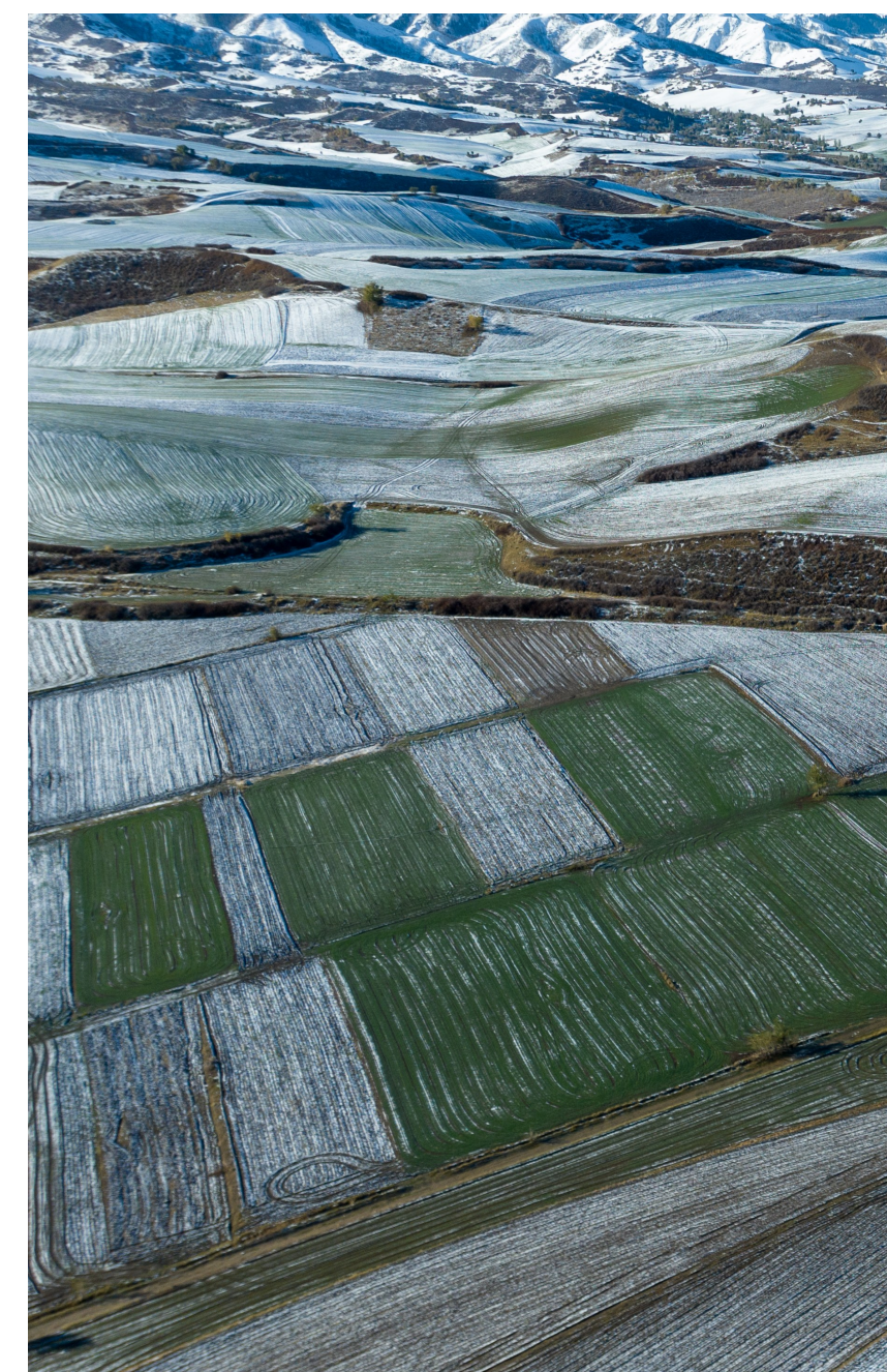
①② 10月21日，木垒县东城镇沈家沟村，雪后的村庄显得十分宁静。