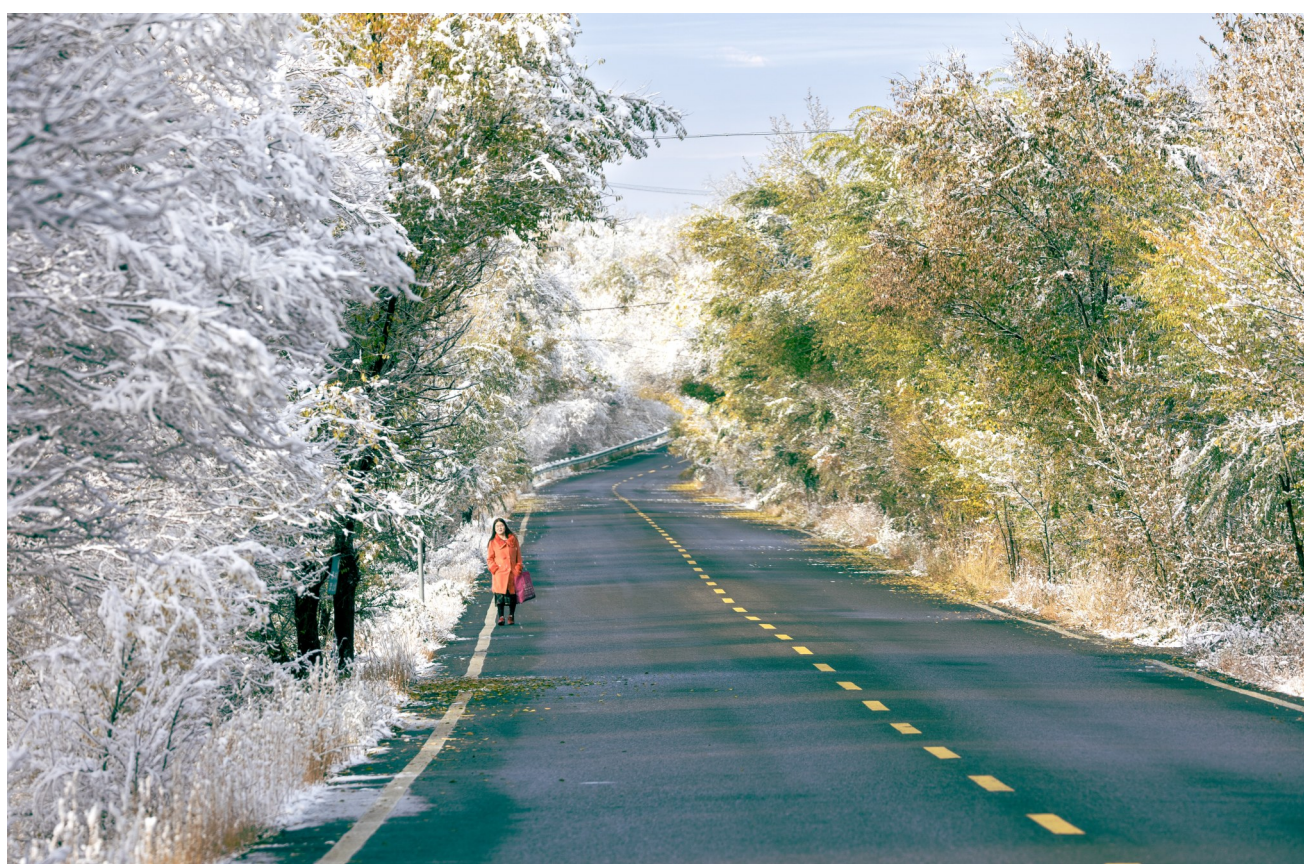
⑤ 10月21日，雪后初晴，木垒县咬牙沟风景区出现了奇特的雾凇景观。

近日，在木垒县南部山区，一场秋雪不期而至，人们看到了秋雪与大地交融的奇妙景观。在东城镇沈家沟村，倏忽之间，大地便完成由秋入冬的交接，无垠的大地像是被打翻了的调色盘，万亩旱田一夜之间披上了银装，宛如一幅山水泼墨画，清新素雅，恬淡静谧。