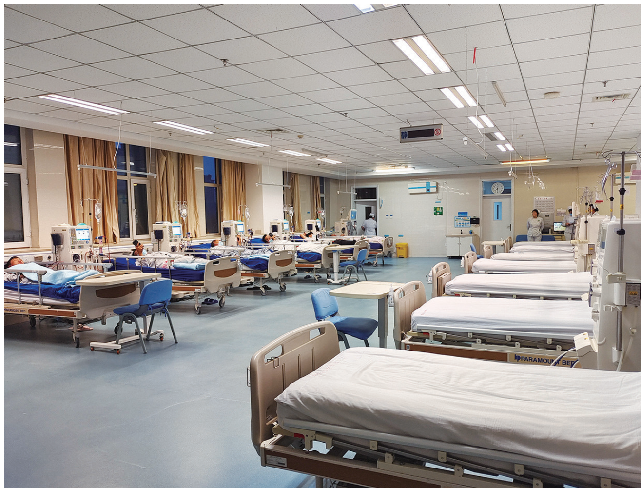
10月23日，新医大一附院昌吉分院血液净化室内，患者在进行夜间血液透析治疗。

据了解，新医大一附院昌吉分院血液净化室成立于2013年7月，目前科室拥有费森尤斯血液透析机22台，5008s血液透析滤过机3台、日机装血液透析机2台、费森水机1台，可常规开展血液透析、血液透析滤过、血液灌流、无肝素透析及床旁血液透析等技术项目。