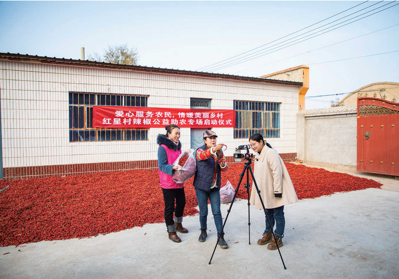
11月1日，昌吉市二六工镇红星村，网络达人正在直播销售辣皮子。 当天，昌吉市民政局驻二六工镇红星村工作队联系爱心企业，帮助销售红星村生产的辣皮子，通过直播销售2吨辣皮子，销售额达7万余元。 □本报记者 巨海成摄

手续……一步到位的措施让木垒县新能源产业发展势如破竹。1—9月，木垒县新能源发电量突破了百亿千瓦时，达到了101亿千瓦时，同比增长28%。46家新能源规上企业实现增加值23亿元，同比增长38.7%，43家新能源企业实现增加值22.8亿元，增速全州第一。