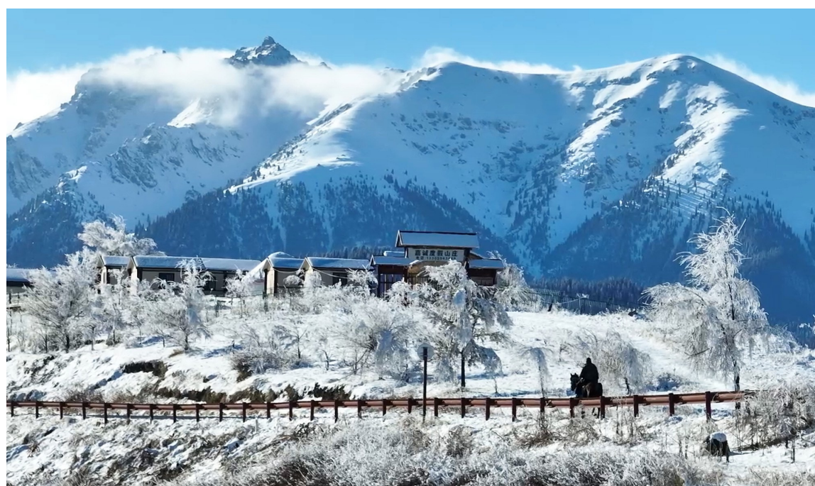
江布拉克景区,积雪覆盖着山野,更显静谧悠远。