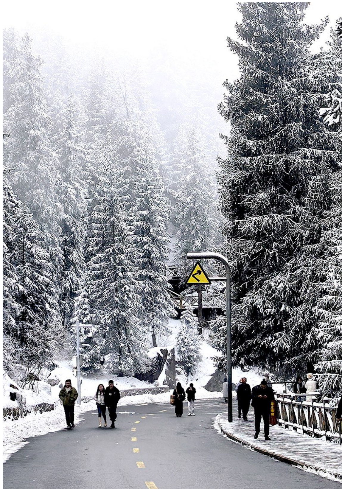
游客在天山天池景区享受着雪后清新的空气和宁静的氛围。