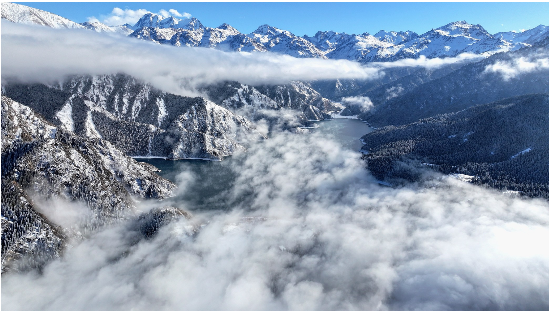
天山天池景区云雾缭绕,银装素裹,分外妖娆。