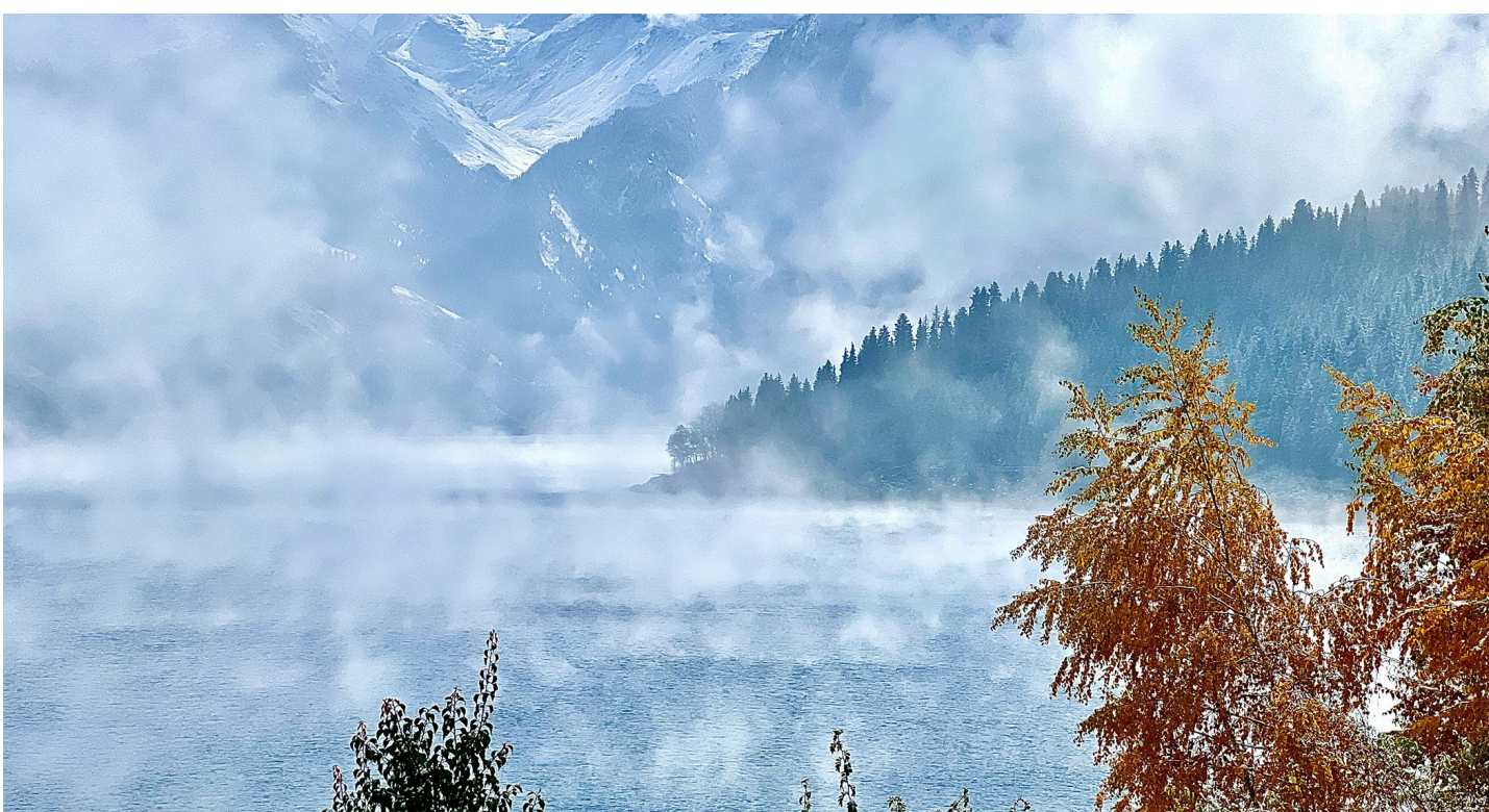
天山天池景区深秋的黄叶遇到初冬的白雪,半是秋景半是冬的美丽画卷已经翻开。