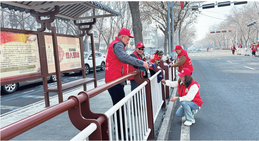
近日,“庭州老兵”木垒县退役军人志愿服务大队的志愿者清洁城市护栏。

昌吉州退役军人事务局结合实际,着眼传承人民军队优良传统、发挥退役军人优势,以打造“庭州老兵”品牌为总抓手,统一名称、统一旗帜、统一标识、统一服装,依托基层退役军人服务中心(站)构建志愿服务矩阵,初步形成“州支队、县(市)大队、乡镇(街道)中队、村(社区)队”和“州支队+专业队伍”的退役军人志愿服务组织架构体系。目前,全州400余支退役军人志愿服务队在各个领域发光发热,赢得了群众、社会的广泛赞誉。