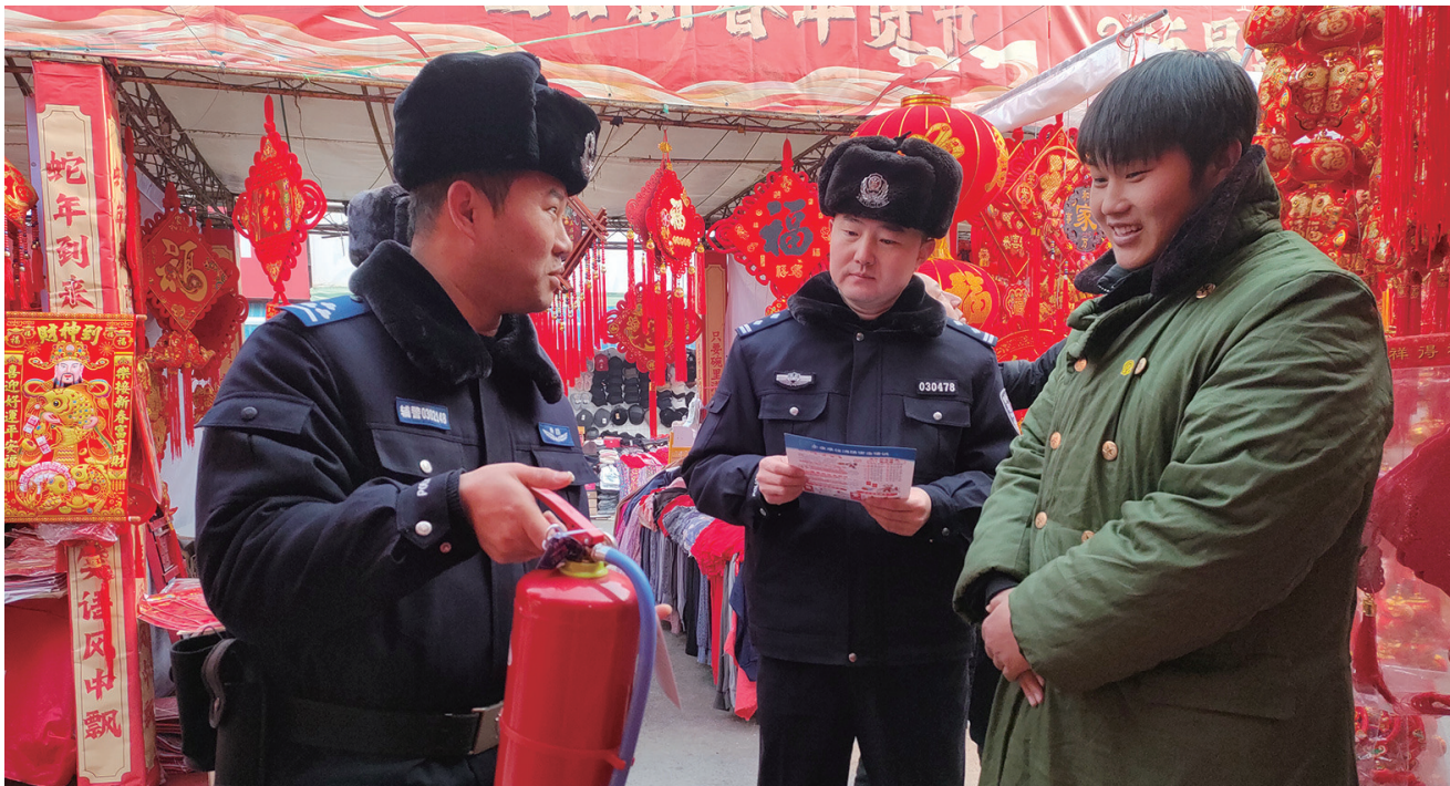
1月23日，昌吉市公安局北京南路派出所警务人员在昌吉市亚中商城年货大集进行消防安全检查。