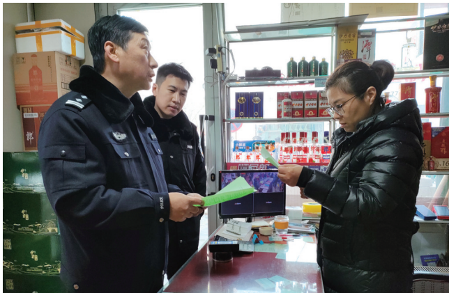
1月23日，昌吉市公安局食品药品环境犯罪侦查大队民警在烟酒商行开展风险隐患排查。