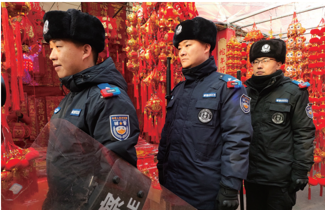
1月23日，昌吉市公安局北京南路派出所警务人员在昌吉市亚中商城年货大集巡逻。

1月23日，昌吉市公安局民辅警开展了“送货上门”服务，他们带着独特的“年货”奔赴年货大集和各大商超，用忠诚和担当守护万家灯火。