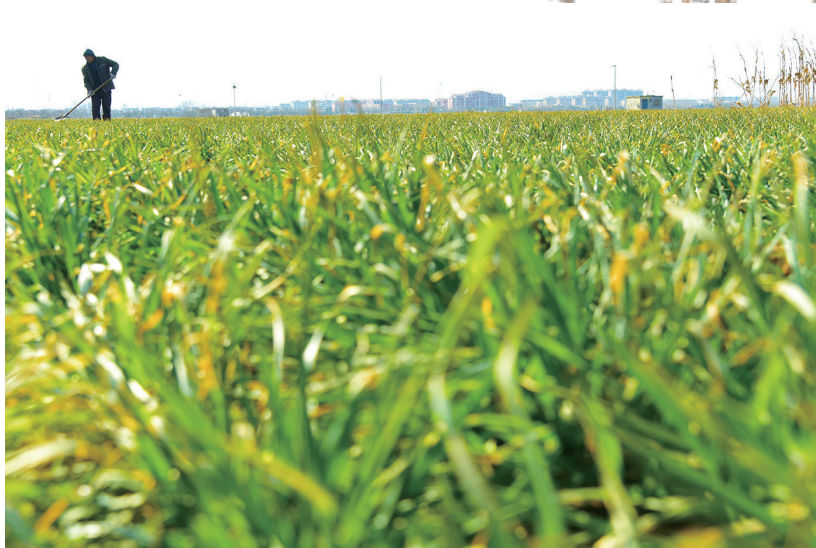
2月9日,山东省枣庄市山亭区城头镇徐洼村农民在麦田劳作。 立春过后,各地农民积极开展农业生产,田间地头呈现一派人勤春早的农忙景象。