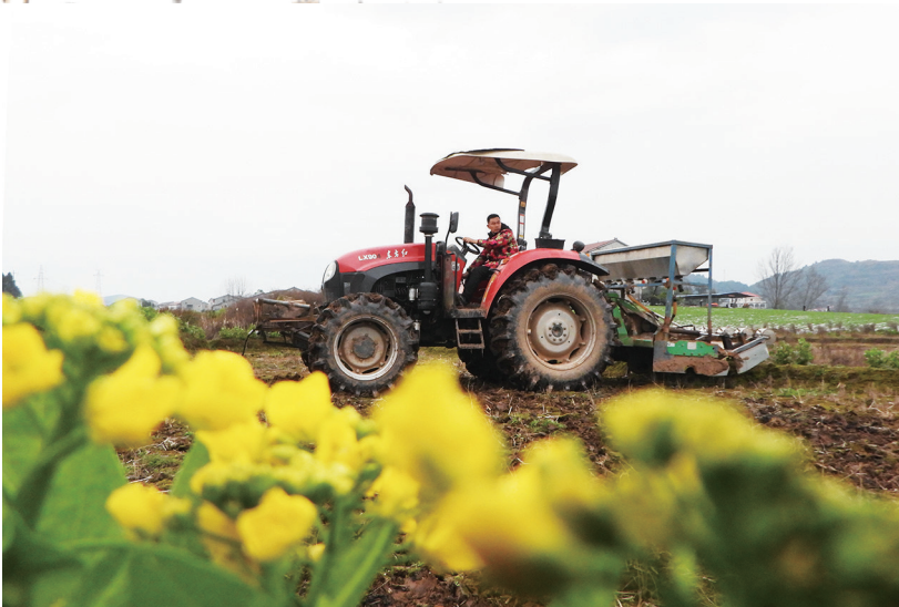
2月7日,在四川省达州市渠县临巴镇四面村,村民驾驶农机翻田准备播种玉米。 立春过后,各地农民积极开展农业生产,田间地头呈现一派人勤春早的农忙景象。