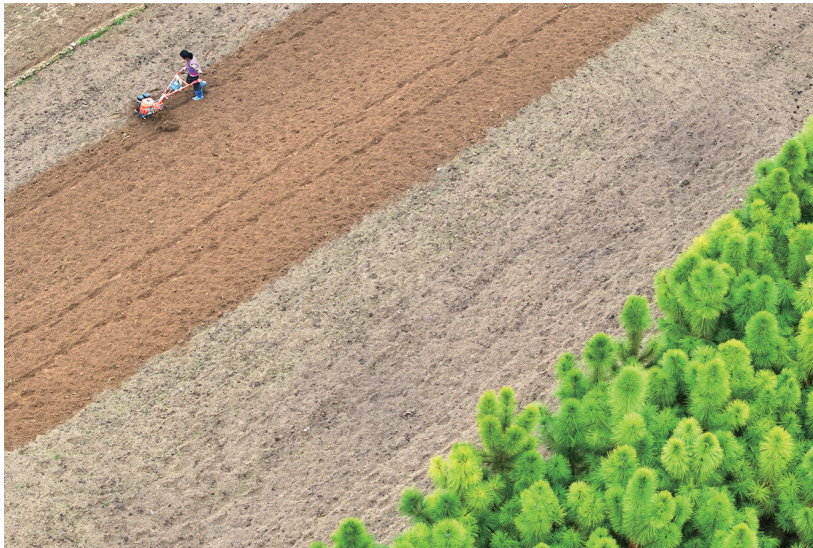
2月7日,在江西省吉安市泰和县澄江镇南门村,农民翻耕整地,准备春播春耕。 立春过后,各地农民积极开展农业生产,田间地头呈现一派人勤春早的农忙景象。