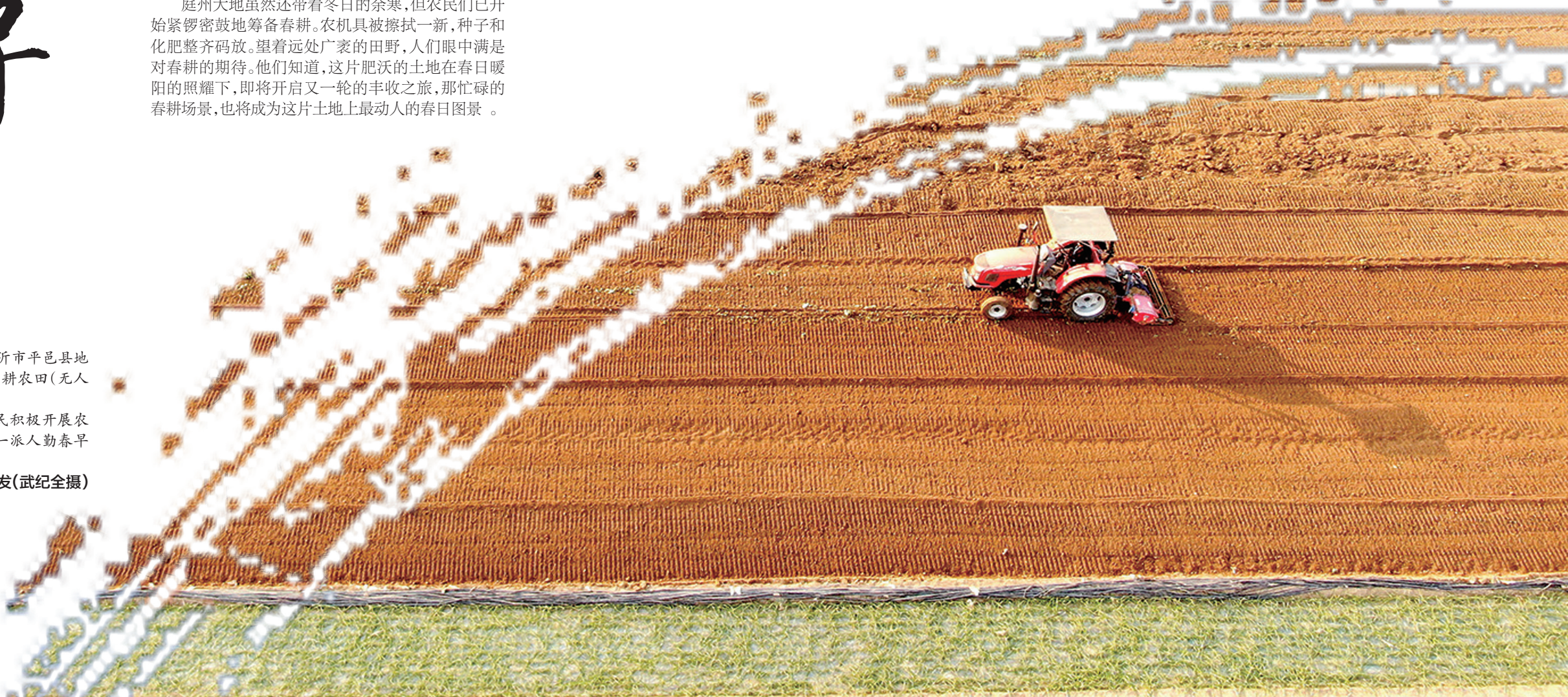
2月4日,山东省临沂市平邑县地方镇农民驾驶农机在翻耕农田(无人机照片)。 立春过后,各地农民积极开展农业生产,田间地头呈现一派人勤春早的农忙景象。