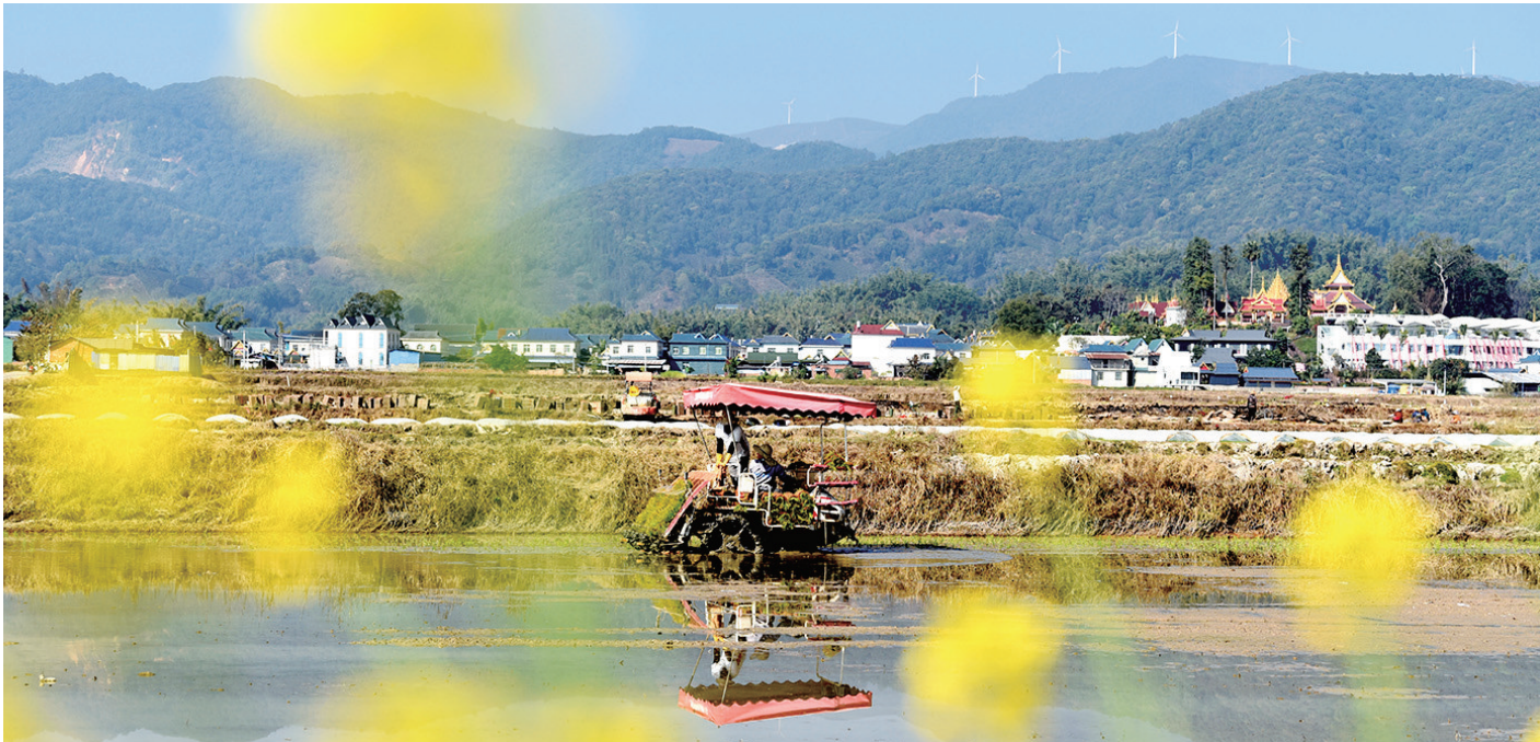
2月7日,在云南省西双版纳州勐海县曼朗村,插秧机在插秧。 立春过后,各地农民积极开展农业生产,田间地头呈现一派人勤春早的农忙景象。

“律回岁晚冰霜少,春到人间草木知。”当第一缕春风轻柔地拂过祖国大地,当第一抹嫩绿悄然从泥土中探出脑袋,春,便带着它独有的蓬勃与希望,翩然而至。 春风轻拂,唤醒了沉睡的大地,也奏响了农忙序曲。 田野间,农民驾驶着拖拉机来回穿梭。那铁犁破开紧实的泥土,新翻的土壤如波浪般起伏,散发着醇厚的气息。望着翻开的土地,辛勤劳作的人们眼神里满是期待,仿佛已看到金秋的丰硕。 菜地里,翠绿的菜苗星星点点。菜农们头戴草帽,俯身忙碌。他们仔细拔除杂草,轻柔浇水,动作娴熟又温柔。每一株菜苗,都承载着他们的心血与希望。 果园内,果农们手持剪刀,在果树间灵活穿梭。他们精心修剪着树枝,去除病枝、弱枝,让果树能够更好地吸收养分。阳光透过稀疏的枝叶洒下,映照果农们古铜色的脸庞,汗珠闪烁着光芒。 水田中,插秧的时节到了。农户挽起裤脚,踏入水田。他们弯腰弓背,将嫩绿的秧苗一株株插入泥中。水田里,倒映着蓝天白云和他们忙碌的身影,宛如一幅灵动的田园水墨画。 人勤春早,春天是起点,是希望。农民用勤劳的双手,在大地上书写着属于自己的故事。他们的汗水,滴落在土地里,孕育着无限生机;他们的梦想,在春天里种下,等待着时光的滋养与绽放。 庭州大地虽然还带着冬日的余寒,但农民们已开始紧锣密鼓地筹备春耕。农机具被擦拭一新,种子和化肥整齐码放。望着远处广袤的田野,人们眼中满是对春耕的期待。他们知道,这片肥沃的土地在春日暖阳的照耀下,即将开启新一轮的丰收之旅,那忙碌的春耕场景,也将成为这片土地上最动人的春日图景。