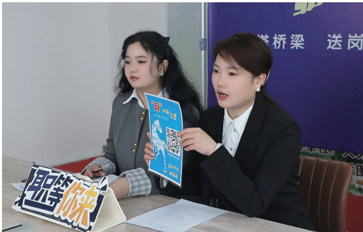
2月27日,在呼图壁县公共就业服务中心“直播带岗”现场,工作人员正在进行岗位展示。