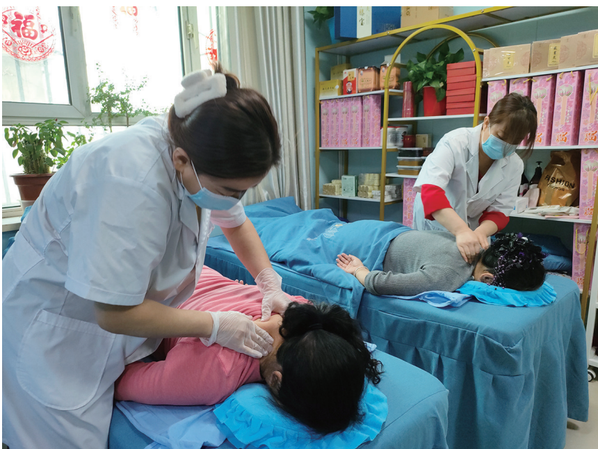
2月25日,居民在水电巷社区康养中心按摩。