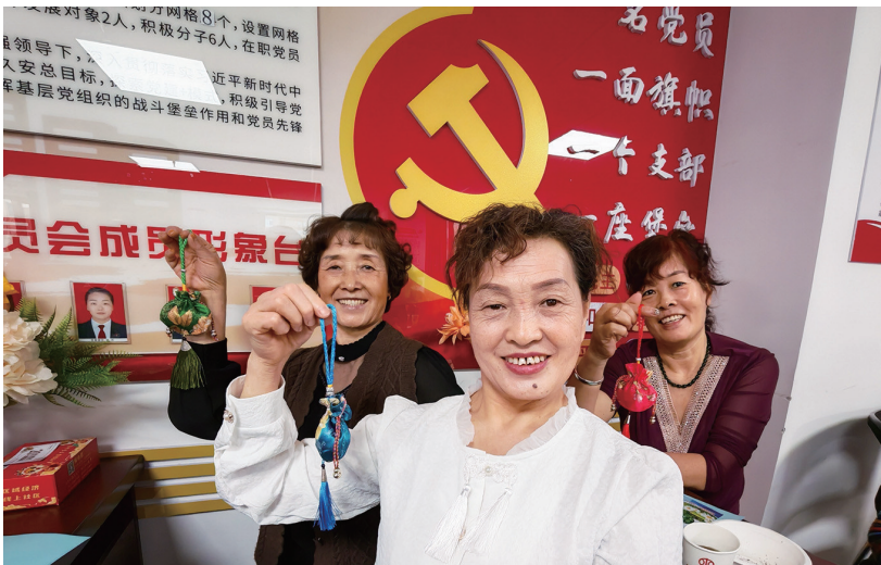
3月4日，昌吉市建国路街道明苑社区，辖区居民展示亲手制作的中药香包。