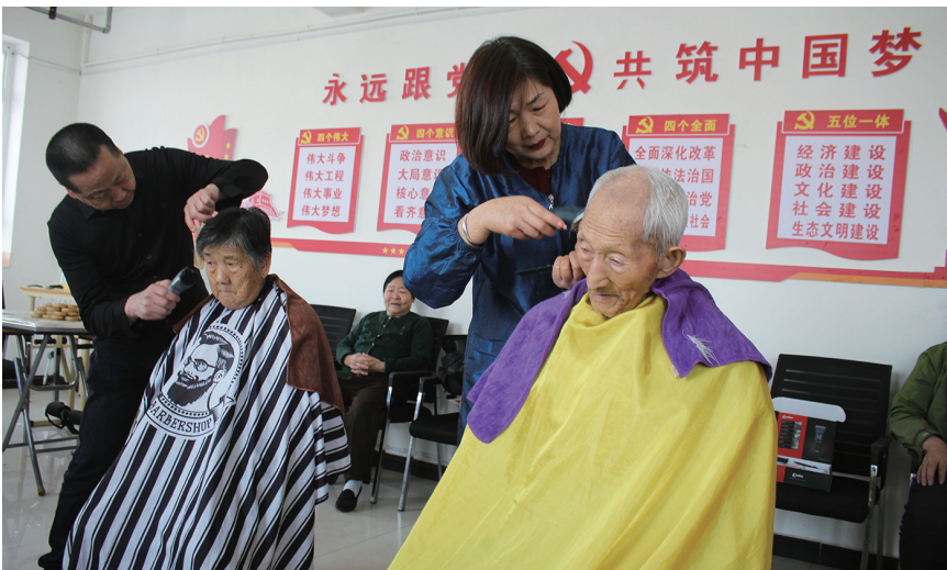
为大力弘扬雷锋精神和“奉献、友爱、互助、进步”的志愿精神，2月28日，吉木萨尔县退役军人事务局组织10名退役军人志愿者开展志愿服务活动，图为志愿者为老人义务理发。