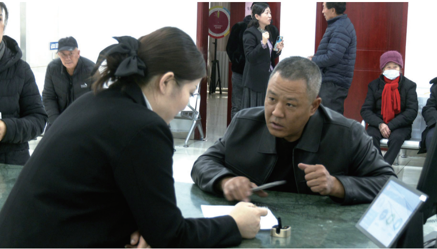
近日，新疆岚安物流有限公司的职工在玛纳斯县政务服务中心社保窗口办理社保业务。