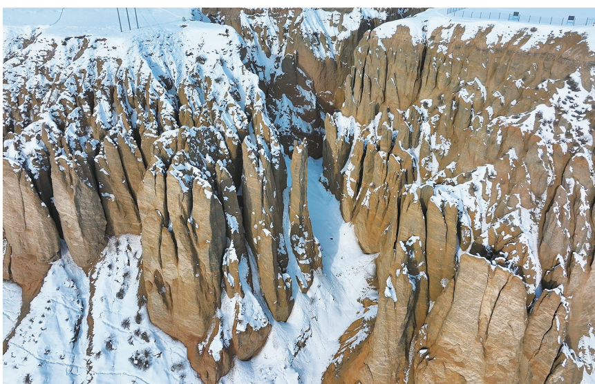
昌吉市努尔加水库周边山地千沟万壑，风貌独特。

虽然季节已到春天，但是昌吉市努尔加水库依然银装素裹，宛如一幅冬日水墨画卷。库区群山环绕，白雪皑皑，山石林立，在阳光的照耀下熠熠生辉。陡峭的崖壁上，风蚀岩层与积雪相互映衬，冰冻的湖面如同白色巨幕，托举着蓝天白云和远处的雪山，美不胜收。努尔加水库位于天山北麓，是昌吉市重要的水源地。冬季的努尔加水库呈现出别样的静谧与壮美。