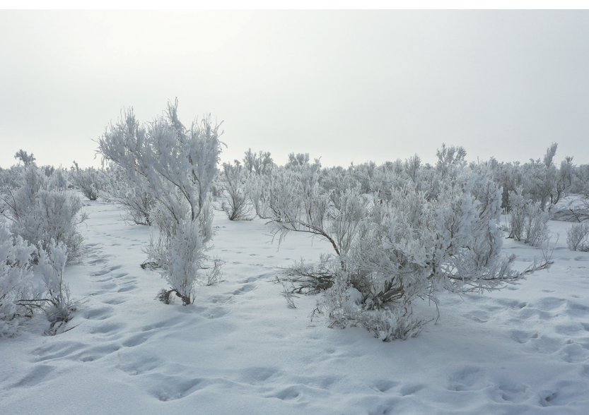
3月3日，昌吉市北部荒漠，梭梭林被雾凇包裹。

干被雾凇包裹，展现出独特的坚毅之美。在阳光的映照下，雾凇闪烁着五彩光芒，与戈壁的硬朗线条相互映衬，构成了一幅绝美的画卷。雾凇的形成得益于近期昌吉市北部荒漠特殊的气象条件。昼夜温差大，加之充足的水汽，使得空气中的水汽在低温下直接凝华，附着在红柳、梭梭等植物表面，从而形成了这一壮丽的自然奇观。