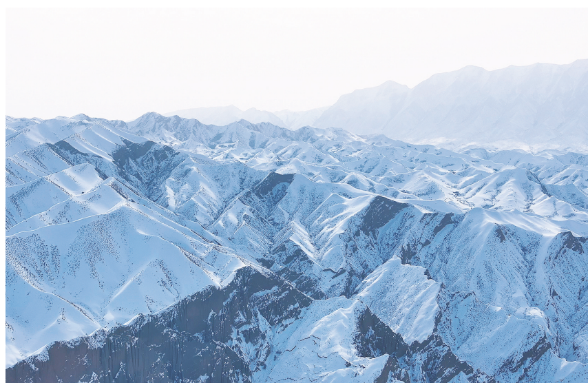
昌吉市南部山区群山环绕，白雪皑皑。