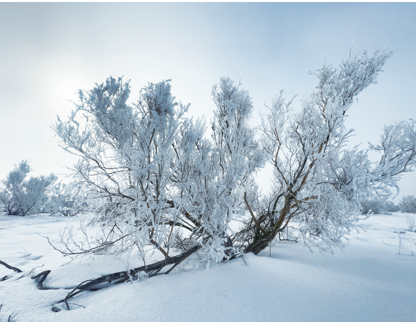
3月3日，昌吉市北部荒漠呈现出如梦如幻的雾凇景观。在广袤无垠的戈壁壁上，原本干枯的植被被一层晶莹剔透的霜花所覆盖，变成冰雪仙境。