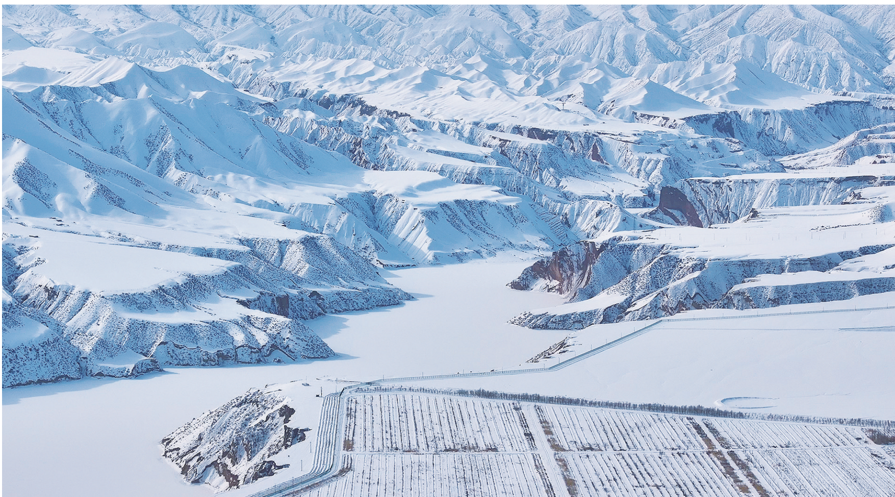
昌吉市努尔加水库银装素裹，宛如一幅冬日水墨画。