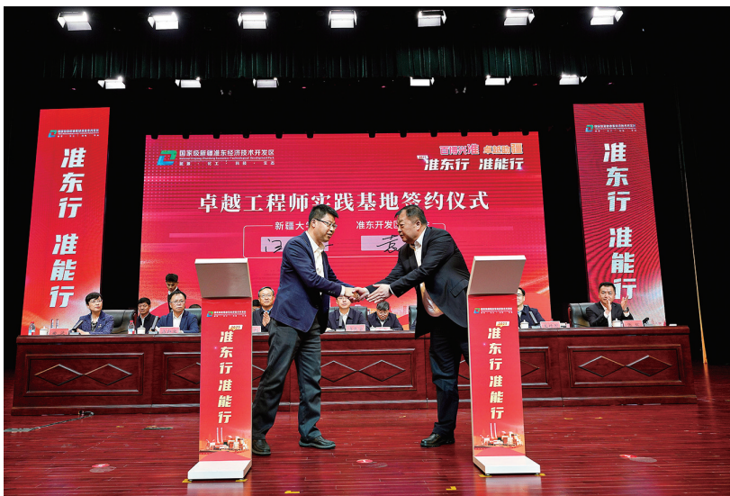
3月25日,新疆大学卓越工程师实践基地签约仪式现场。