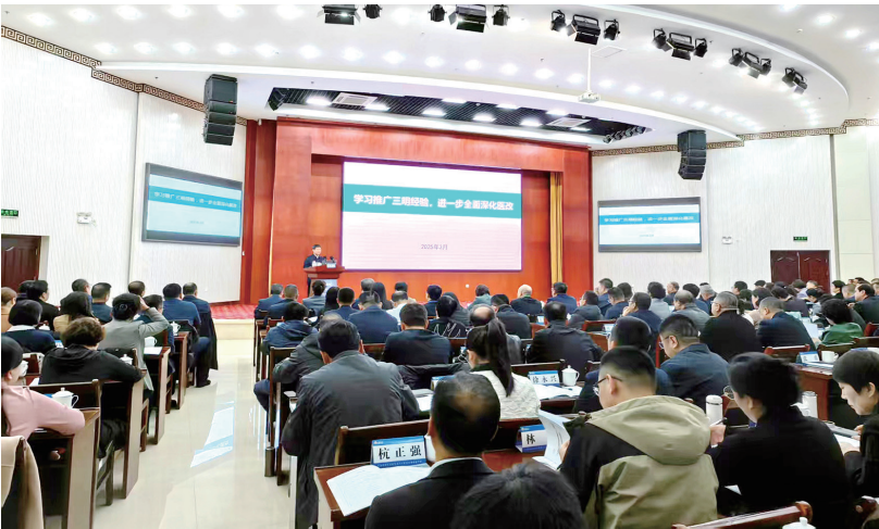
3月24日,2025年自治区深化医改暨推广三明医改经验培训班开班。

此外,教育引导各单位严格遵守公务活动用餐管理规定和标准,遵循有利公务、务实节俭、严格标准、简化礼仪、高效透明和外事礼仪的原则,杜绝餐桌上的浪费,充分发挥公共机构示范引领作用,以党和政府带头过“紧日子”换来老百姓的“好日子”,让厉行节约、反对浪费在全社会蔚然成风。