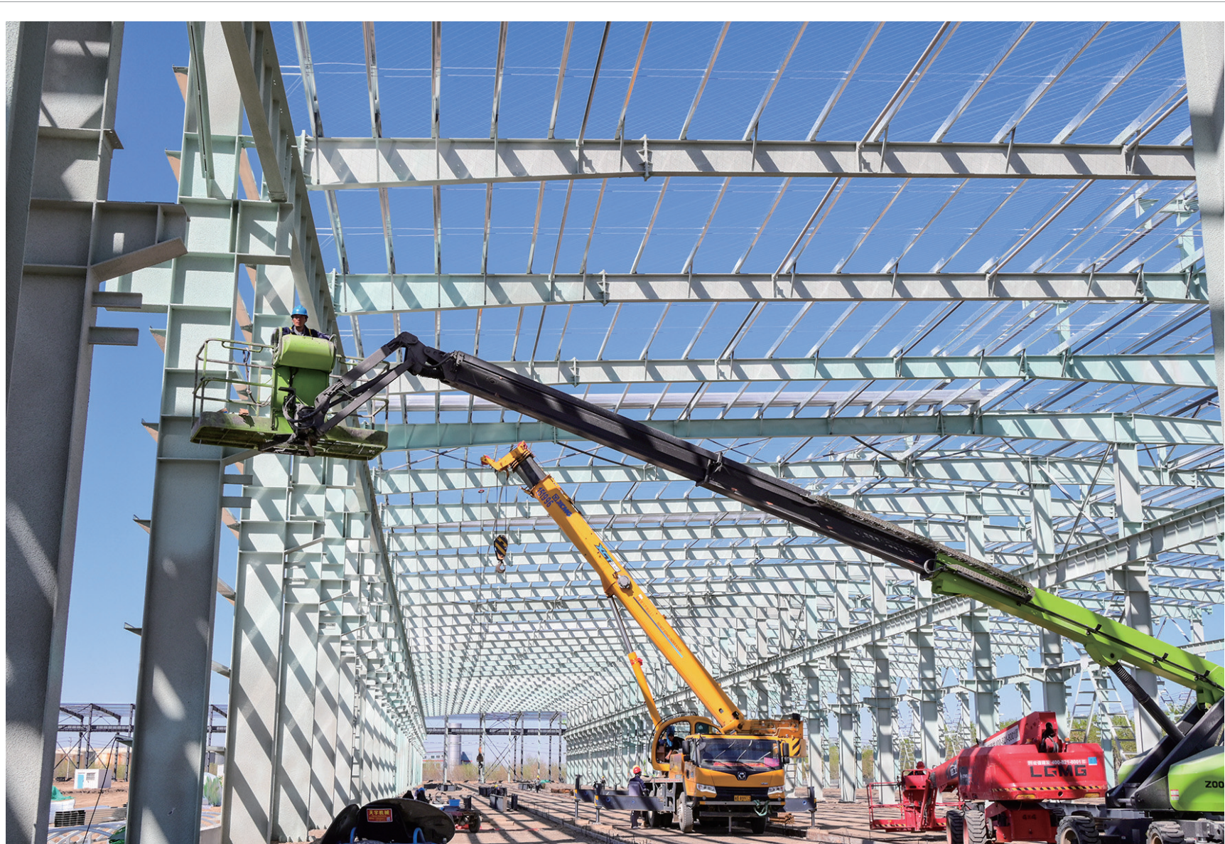
建设智能制造基地

4月21日,工人在昌吉国家高新技术产业开发区兴通智能制造产业基地建设现场施工。该项目计划建设两期智能生产厂房,预计建成后可年产钢结构构件8万吨,将成为西北地区重要装配式建筑产业基地。