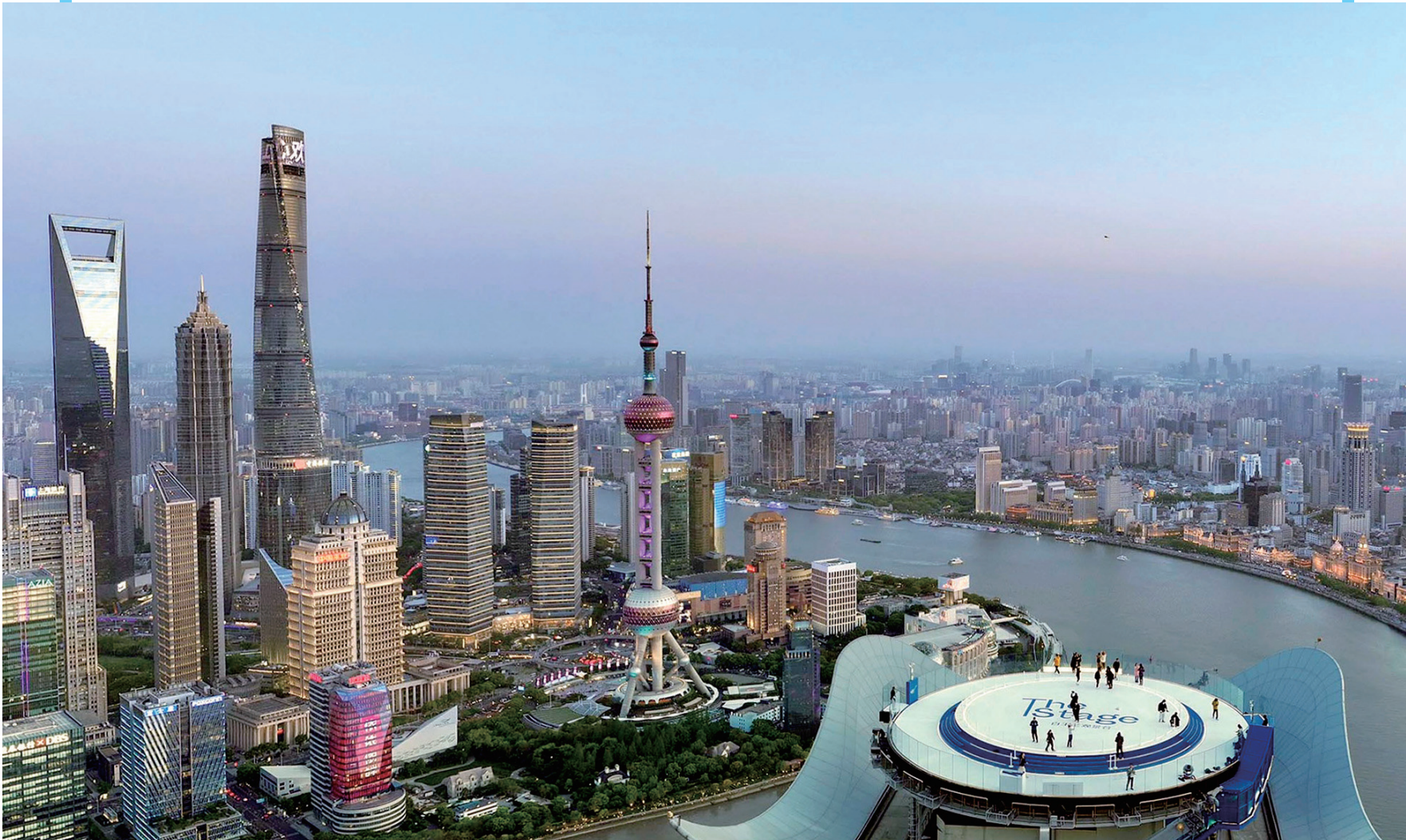
上图:4月14日拍摄的白玉兰观景台(无人机照片)。

4月15日,位于上海白玉兰广场顶层的The Stage白玉兰观景台正式对外开放,市民游客可在320米高度,全景式欣赏充满魅力的城市天际线。