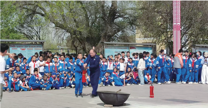
近日,呼图壁县应急管理局联合消防救援大队在县一小开展火灾应急逃生疏散演练。