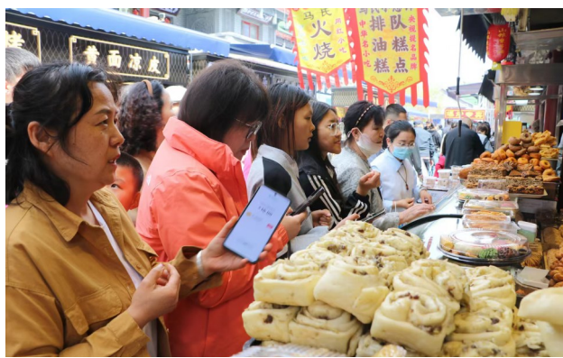
图为游客在昌吉小吃街购买特色糕点。