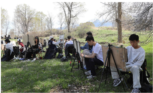
“五一”假期，来自乌鲁木齐市的120名学生走进吉木萨尔县新地乡小分子画家村，用手中纸笔记录下这里的秀丽风光。