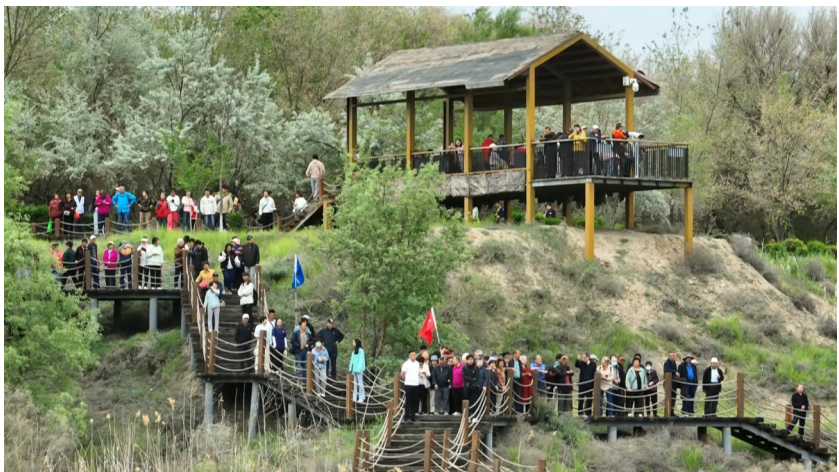
图为在玛纳斯国家湿地公园，游客纷纷前来观鸟、游玩。