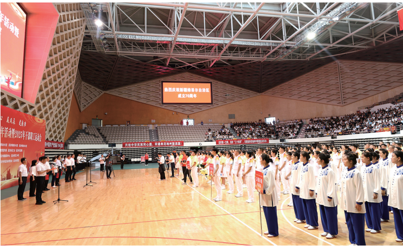
6月25日,昌吉州州直机关庆祝建党104周年活动暨2025年干部职工运动会在昌吉体育馆举行。图为活动现场。 □本报记者 付小芳摄

本报讯 记者付小芳报道:6月25日上午,昌吉体育馆内气氛庄严热烈,昌吉州州直机关庆祝建党104周年活动暨2025年干部职工运动会在这里举行。州直机关单位相关负责人、干部职工代表、纳新党员代表、“光荣在党50年”老党员代表等齐聚一堂,共庆建党104周年华诞,共享运动激情。