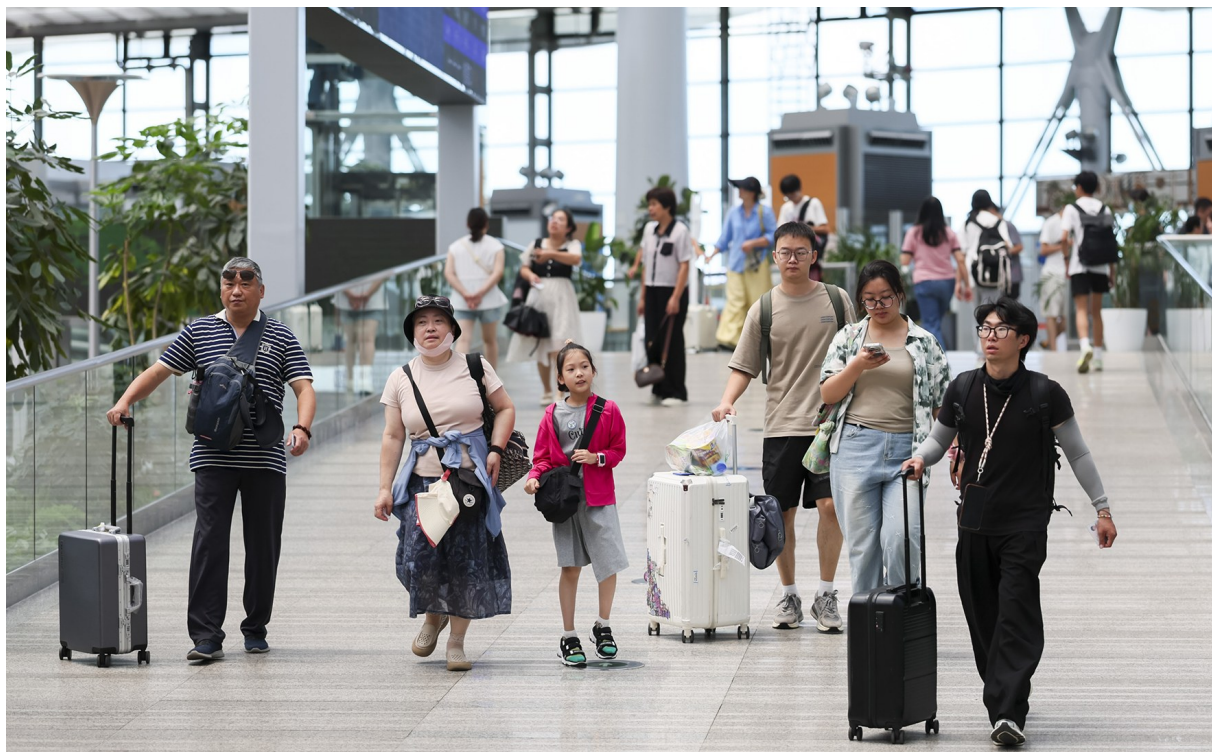
7月1日,旅客行走在上海南站。

7月1日,全国铁路实行新的列车运行图,同时为期62天的2025年全国铁路暑期运输也拉开帷幕。