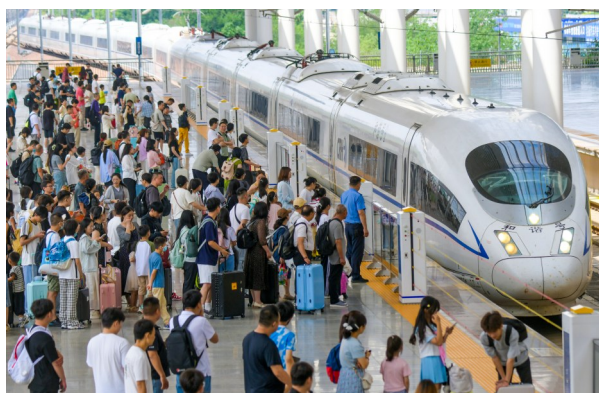
7月1日,旅客在河南洛阳龙门站乘车。