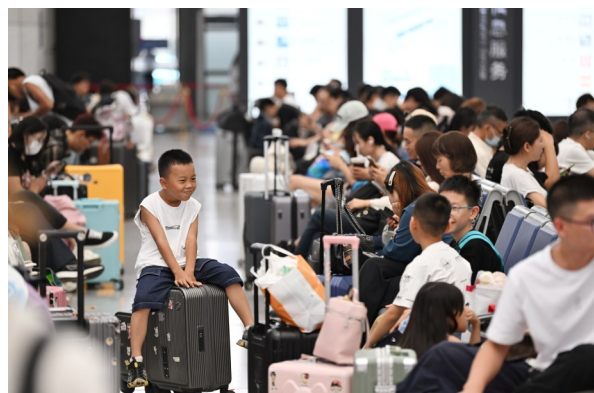
7月1日,旅客在天津西站候车。