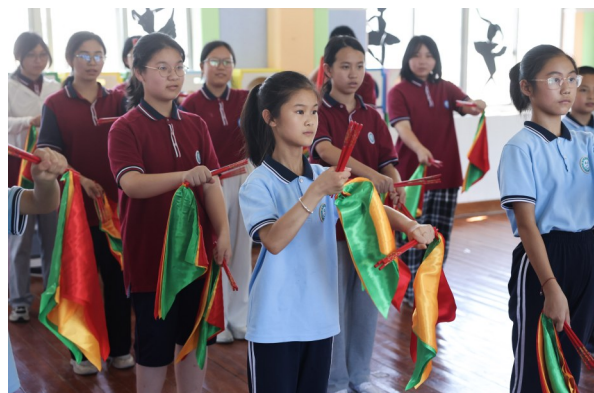
7月1日,东和乡中心学校的孩子们学习筷子舞。