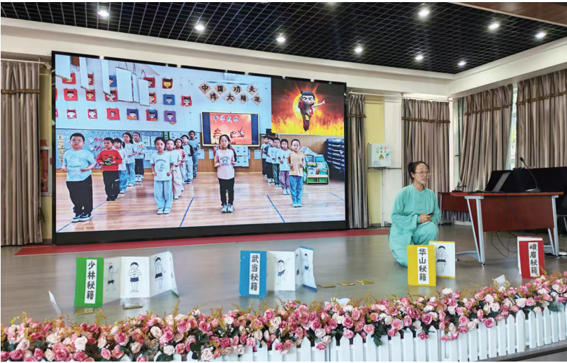
近日，昌吉州学前教育工作室开展联合研修活动，优秀教师正在进行教学展示。

本次联合研修以内容充实、精准聚焦为特色，不仅让成员沉浸式感知多所优质园所的办学精髓，还依托教学展示、经验共享与深度研讨，有效拓宽了成员的专业视野，真正实现了优质资源共享、信息互通、教学共研的目的，为昌吉州学前教育内涵式发展注入了强劲动能。