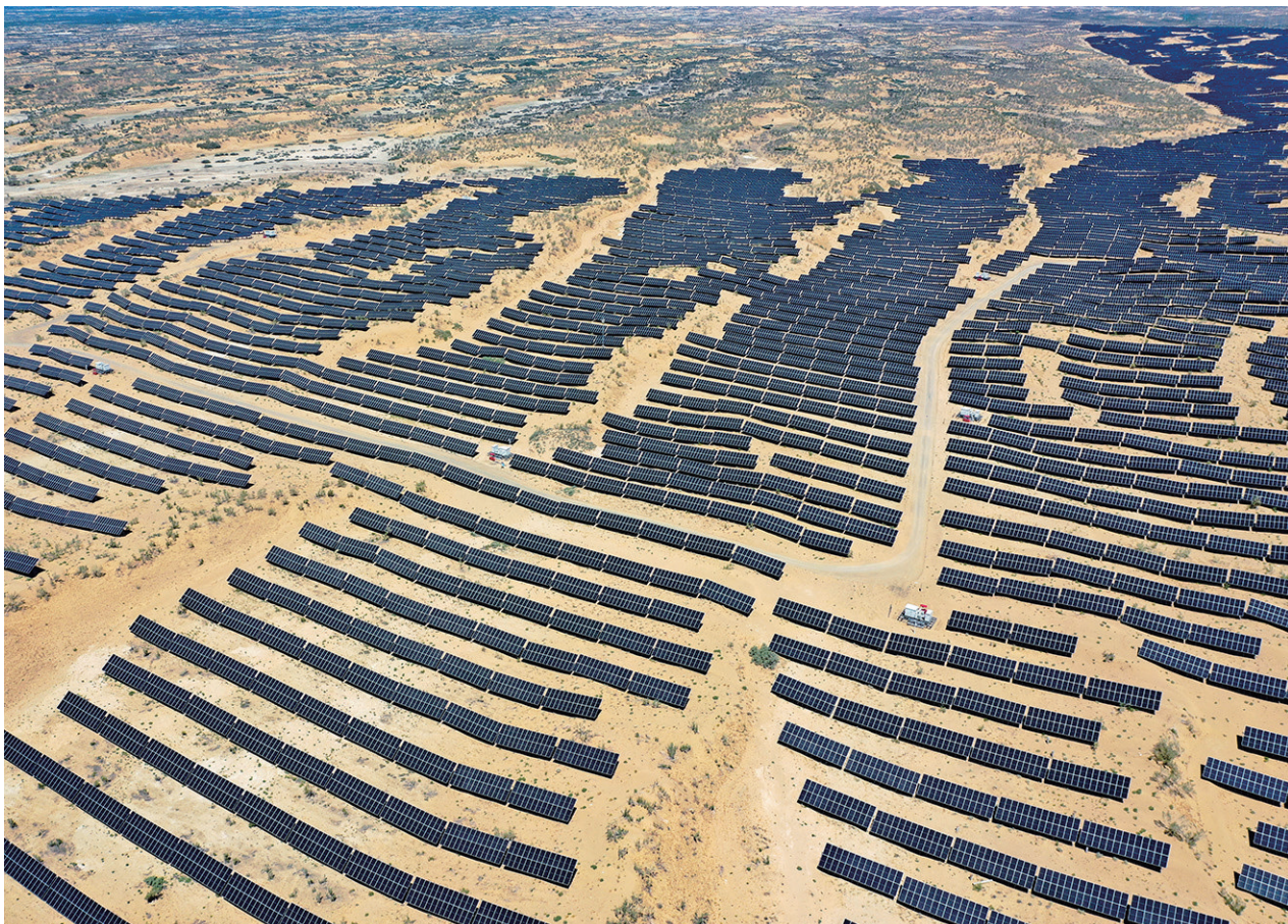
7月9日，在乌鲁木齐市米东区北部沙漠光伏基地，成片的太阳能光伏板依次排列，犹如蓝色海洋。

安装了104万块，采用逆变升压一体机并网方案，并新建一座220千伏升压汇集站，实现光伏电力稳定收集和输出。”刘宝介绍，目前，这些光伏板产生的绿电，正源源不断地输往乌鲁木齐甘泉堡经济技术开发区。