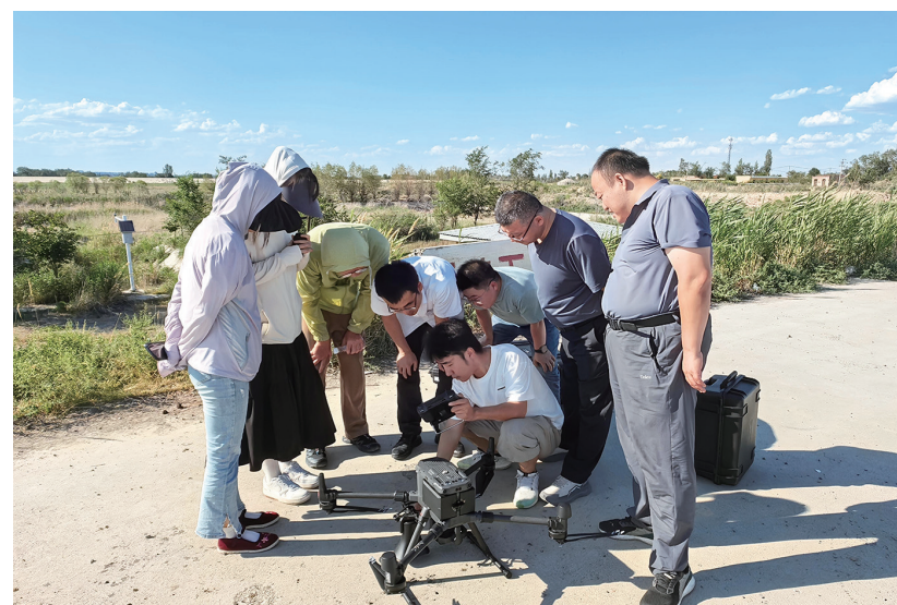
昌吉州水利管理总站青年干部学习无人机机身检查操作。