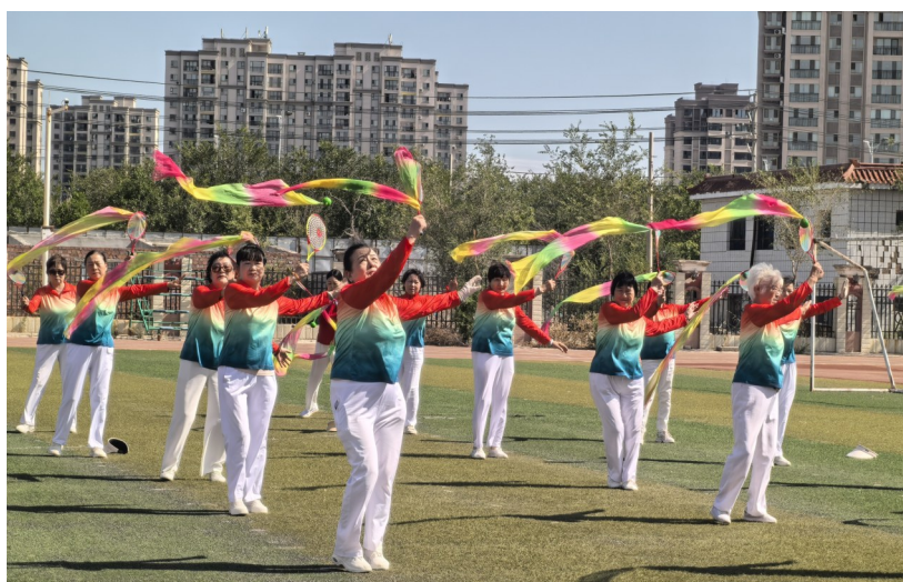
7月10日,在昌吉市一小体育场,昌吉市民身着统一运动服、手持彩绸,在阳光下进行健身表演。