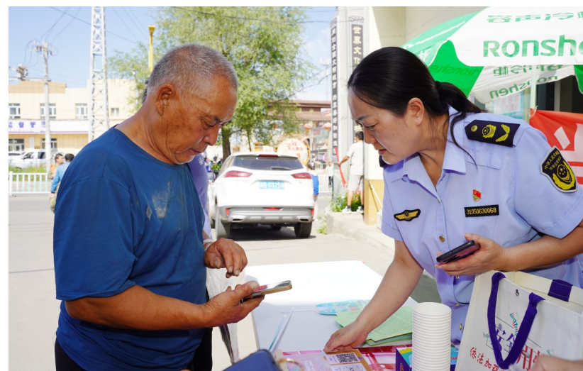
7月15日,吉木萨尔县市场监督管理局、三台镇政府联合开展“尚德守法 共享食安”主题宣传活动,向过往群众发放食品安全宣传手册,呼吁居民做自己的“第一健康责任人”,切实守护居民“舌尖上的安全”。