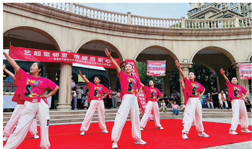
7月11日,嘉顺社区居民正在表演文艺节目。

本报讯 记者左晓雨报道:川剧变脸、器乐演奏、歌舞表演……7月11日,昌吉市建国路街道嘉顺社区第四届邻里文化艺术活动在一片欢乐祥和的氛围中拉开帷幕。此次活动以“艺起聚邻里 情暖百家心”为主题,旨在弘扬与邻为善、以邻为伴的理念,进一步构建和谐社区环境。 活动现场,武术表演、诗朗诵、少儿舞蹈等节目轮番上演,引得居民掌声不断,笑声连连;有奖问答等游戏吸引大家竞相参与,气氛热烈。此外,现场还制作了大锅抓饭、设置了邻里市集,让居民在欣赏节目的同时品尝美食、逛集市。 “这些活动让老人孩子都能参与