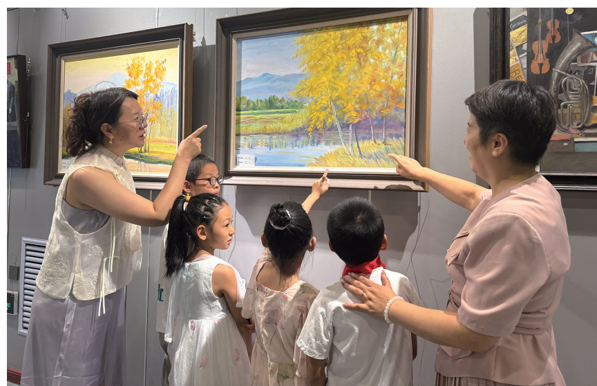
7月18日，“瀚海丹青韵 天山笔墨情”美术作品邀请展在昌吉市青少年宫(美术馆)开展，市民正在观赏画作。

村口，两束金色麦穗雕塑深情守着沃野，“从土地中传承，在土地上创新”的标语熠熠生辉。腰站子村以小麦为“笔”，“一块田”夯实根基，面馆“抓住”游客的胃，博物馆留住农耕的魂，绘就了一幅一二三产深度融合、传统与现代交融的乡村振兴新画卷。