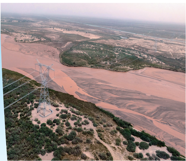
新疆环塔里木盆地750千伏输电线路跨越车尔臣河(6月14日摄)。