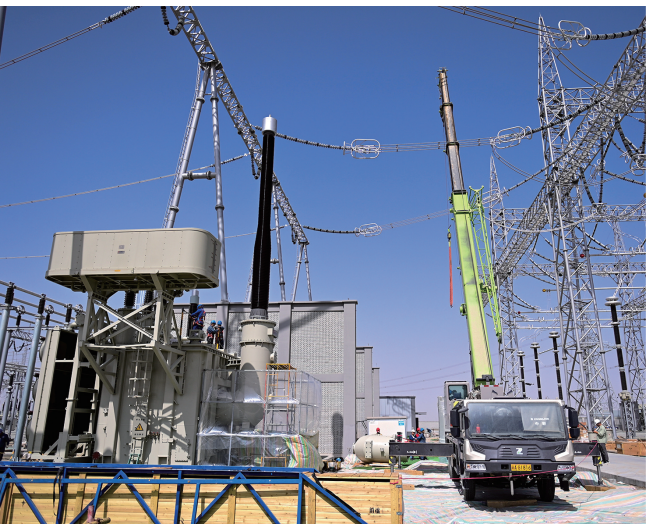
这是建设中的新疆环塔里木盆地750千伏输电工程且末750千伏变电站(6月25日摄)。