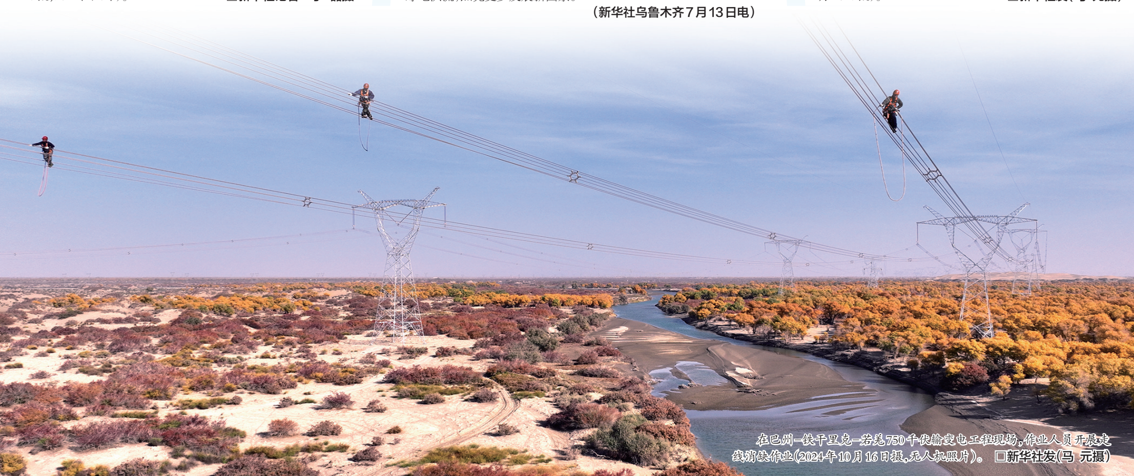
在巴州-铁千里克-若羌750千伏输电工程现场,作业人员开展展线架线作业(2024年10月16日摄,无人机照片)。