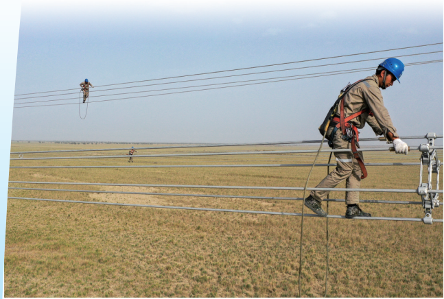
施工人员在且末-若羌750千伏线路开展走线消缺工作(6月24日摄,无人机照片)。