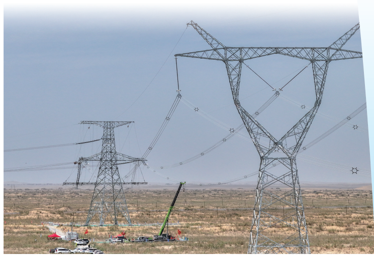
7月13日,民丰-且末750千伏线路全部架设完成,环塔里木盆地750千伏输电工程全线贯通(无人机照片)。