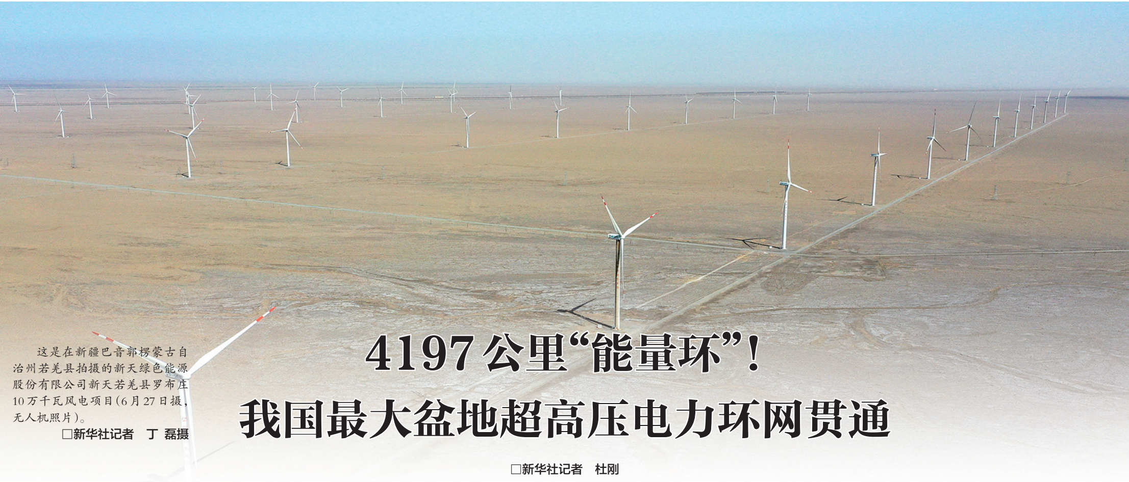
这是在新疆巴音郭楞蒙古自治州若羌县拍摄的新天绿色能源股份有限公司新天若羌县罗布庄10万千瓦风电项目(6月27日摄,无人机照片)。