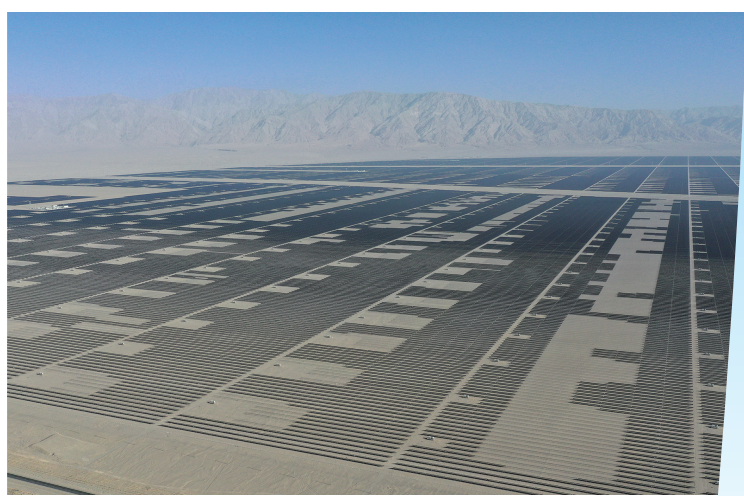
这是中国绿发新疆中绿电若羌400万千瓦光伏项目(6月26日摄,无人机照片)。