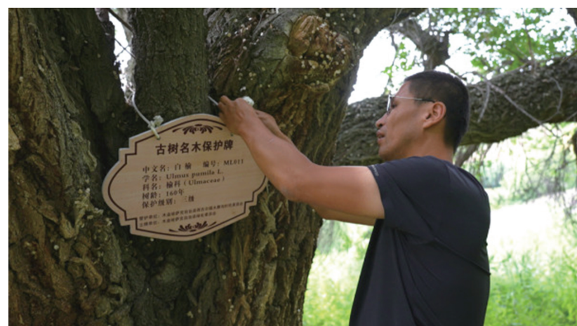
近日,木垒县林业和草原局的工作人员为古树悬挂古树名木保护牌。

为了让更多的人参与保护工作,木垒县还发起了古树认领活动。自今年3月《古树名木保护条例》颁布实施以来,木垒县未发生毁林事件,古树病虫害也得到了有效控制。原本呈现生长衰弱迹象的6棵古树,在经过精心养护后,已重新焕发出生机。