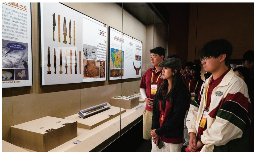
近日,参加“泉昌情·心连京·丝路缘——祖国情·中华行”赴新疆(昌吉)研学活动的华侨大学师生在丝绸之路北庭故城遗址博物馆参观。

“从北庭故城的夯土到特变电工遍布海外工程的‘大国重器’,从商人背起的行囊到现代的集装箱,千年丝路情从未褪色。在‘各美其美、美美与共’的愿景里,续写着属于这个时代的文明对话……我们也要把这里的悠久历史和新时代的发展成就讲给更多人听,让丝路文明在青年一代中薪火相传。”