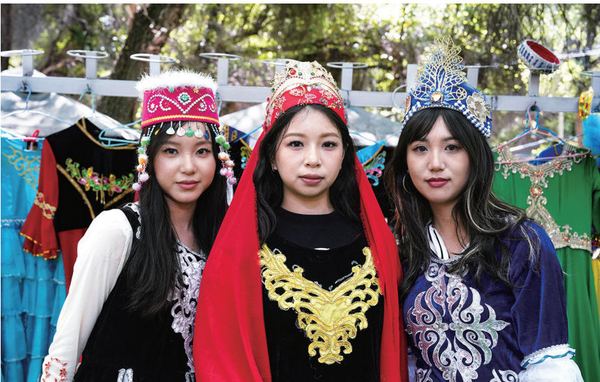
近日,参加“泉昌情·心连京·丝路缘——祖国情·中华行”赴新疆(昌吉)研学活动的华侨大学学子在天山天池景区民俗风情园体验传统民族特色服饰。

研学期间,华侨大学港澳台侨师生亲身感受真实的新疆,与昌吉市第九中学、昌吉市阿什里乡中心学校深入交流,通过体育竞技切磋和“沉浸式”体验学校课程,深入了解新疆素质教育的发展;参观游览昌吉州铸牢中华民族共同体意识主题馆、新疆维吾尔自治区博物馆、丝绸之路北庭故城遗址博物馆等地,触摸新疆各族人民共同开发建设新疆的历史脉络;游览江布拉克、天山天池、火焰山等景区,观赏民俗歌舞表演,在壮美风光中感受多元文化的交往交流交融;探访昌吉科技馆、特变电工、溢达纺织等地,体验新疆前沿科技的发展,见证新疆的蓬勃生机;走进部分援疆项目现场,实地探寻福建省数十