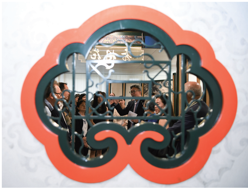
8月22日，在瑞士伯尔尼中国文化中心，嘉宾在“安善萃锦——中式生活美学展”开幕式上聆听讲解。