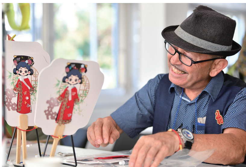
8月22日，在瑞士伯尔尼中国文化中心，嘉宾在“安善萃锦——中式生活美学展”开幕式上体验制作扇子。