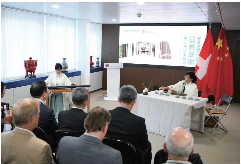
8月22日，在瑞士伯尔尼中国文化中心，嘉宾在“安善萃锦——中式生活美学展”开幕式上观看表演。