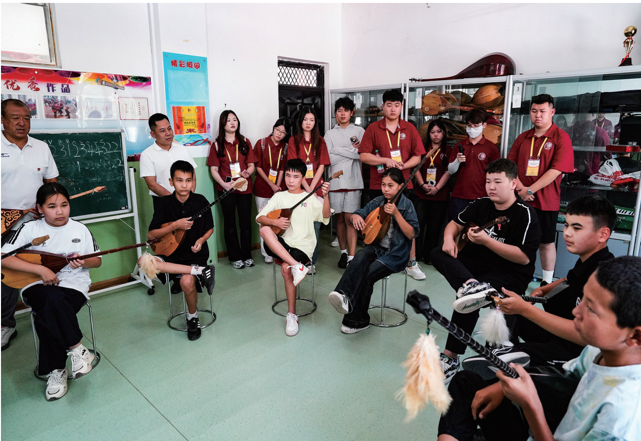
近日，华侨大学港澳台侨学生研学团走访昌吉市阿什里乡中心学校。