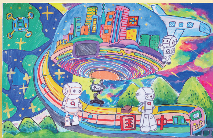
《与科技共绘未来》 马克笔画