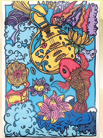
《乐韵鱼欢·盛世繁花》