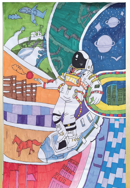
《星际漫游者的多维时空》