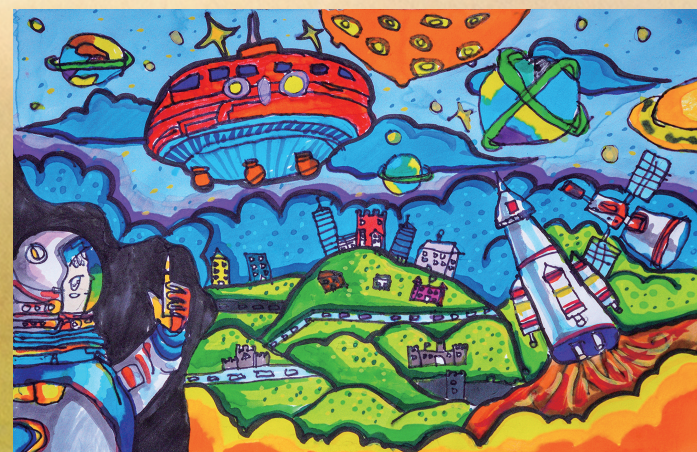
《星辰之梦》 马克笔画