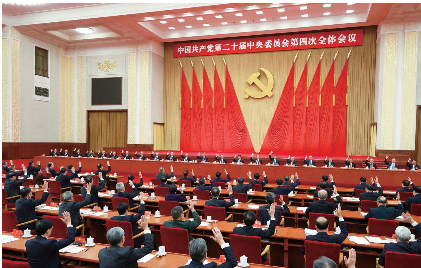
中国共产党第二十届中央委员会第四次全体会议,于2025年10月20日至23日在北京举行。中央政治局主持会议。 □新华社记者 丁涛摄