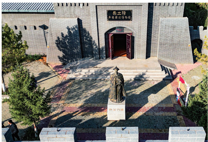
10月18日，乐土驿·新疆驿站博物馆外景。