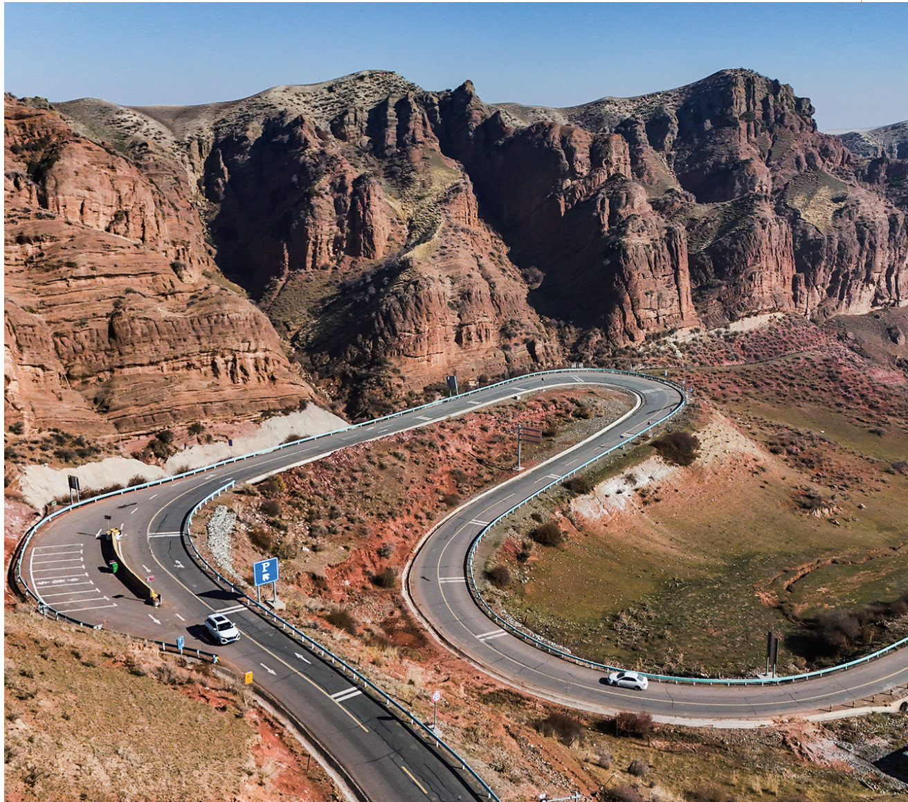
10月25日,呼图壁县南部山区,伴行公路与丹霞地貌相映成景。