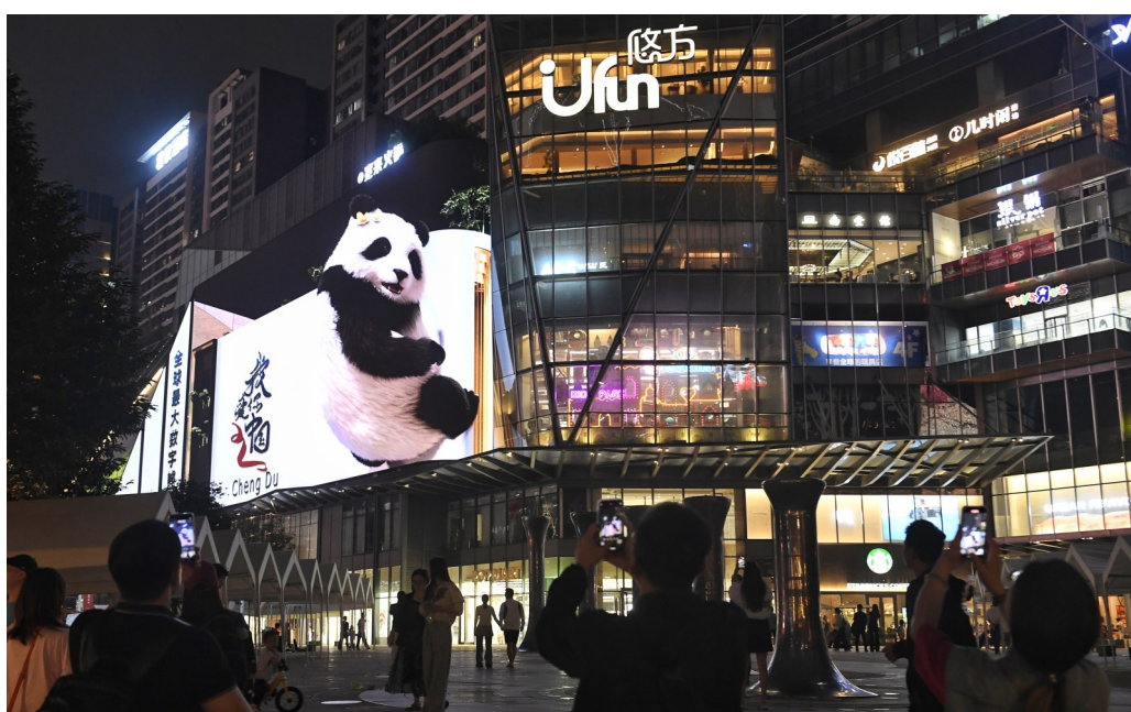
右图:10月14日,市民在拍摄裸眼3D数字熊猫。