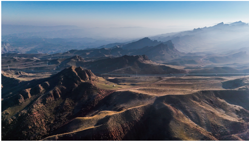
10月25日,呼图壁县南部山区,云雾缭绕。

大景区道路硬化工程,持续推进旅游和交通融合发展,在改善群众出行条件的同时,也为游客提供了高品质的旅游体验,促进当地旅游业高质量发展。