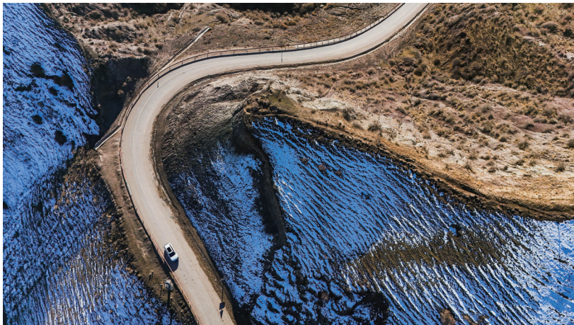
10月25日,呼图壁县南部山区,雪后风景怡人。