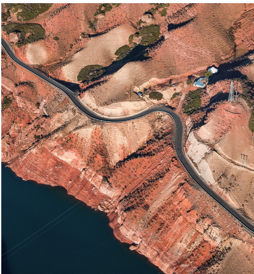
10月25日,呼图壁县南部山区,湖畔伴行公路。