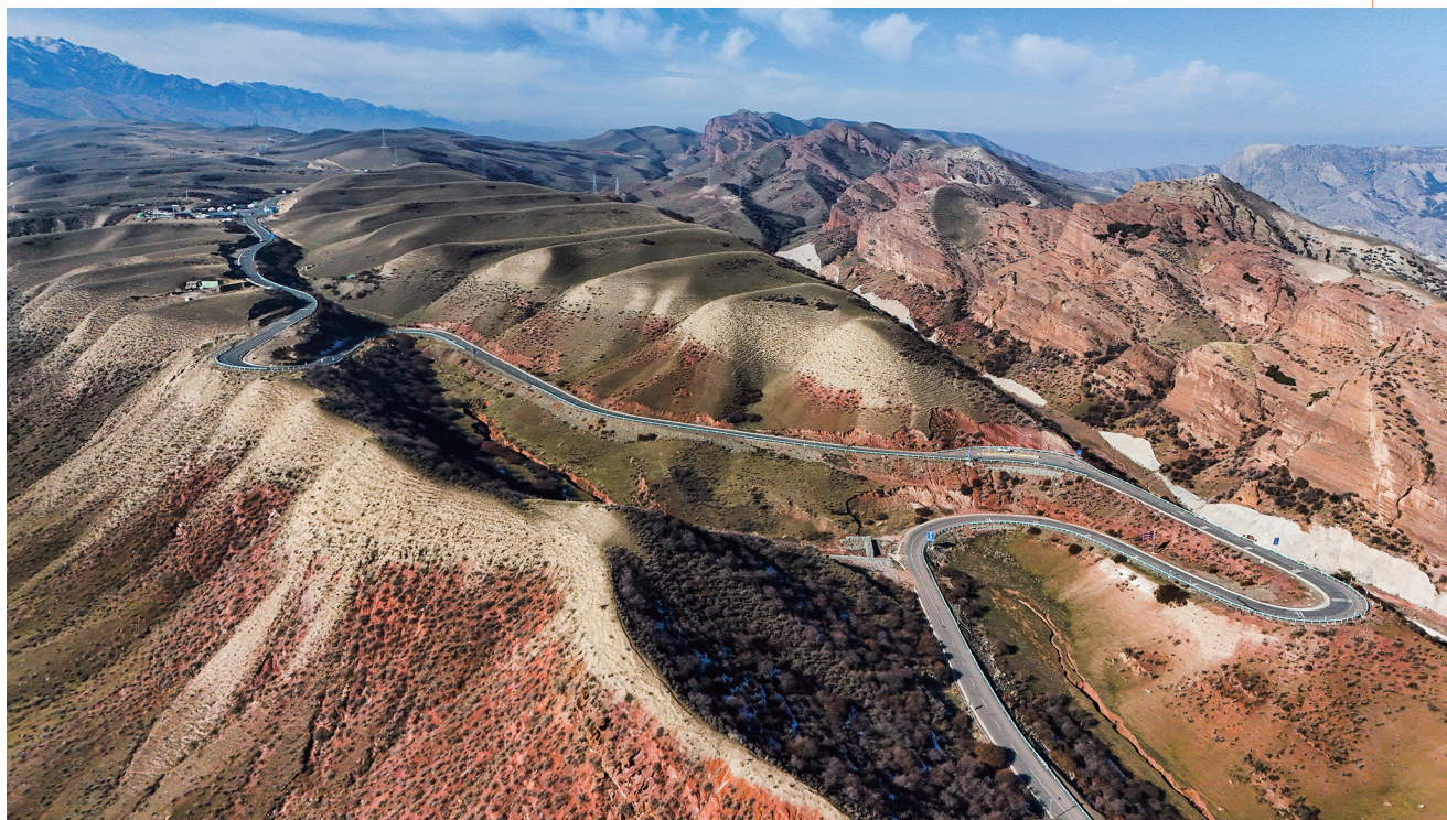
10月25日,呼图壁县南部山区,伴行公路向山区延伸。