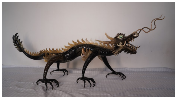
叶力江·巴特尔汗雕刻的作品《龙》。