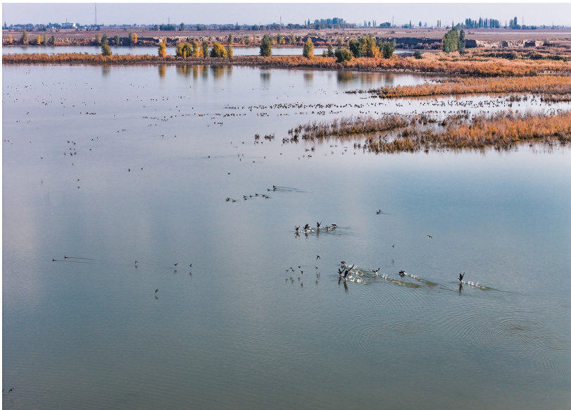
11月5日,呼图壁县小海子湿地秋意正浓,大批水鸟在湿地中觅食嬉戏。