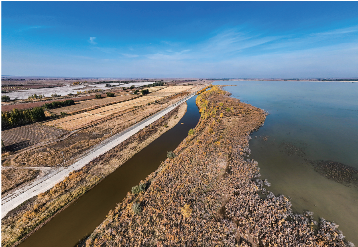
上图:11月5日,呼图壁县小海子湿地秋意正浓,斑斓草木与碧波湖水相映成趣。