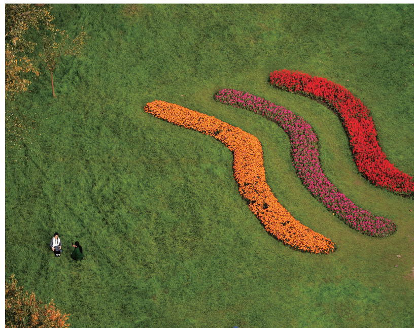
11月3日,游客在江苏省扬州市宋夹城体育休闲公园赏景拍照(无人机照片)。