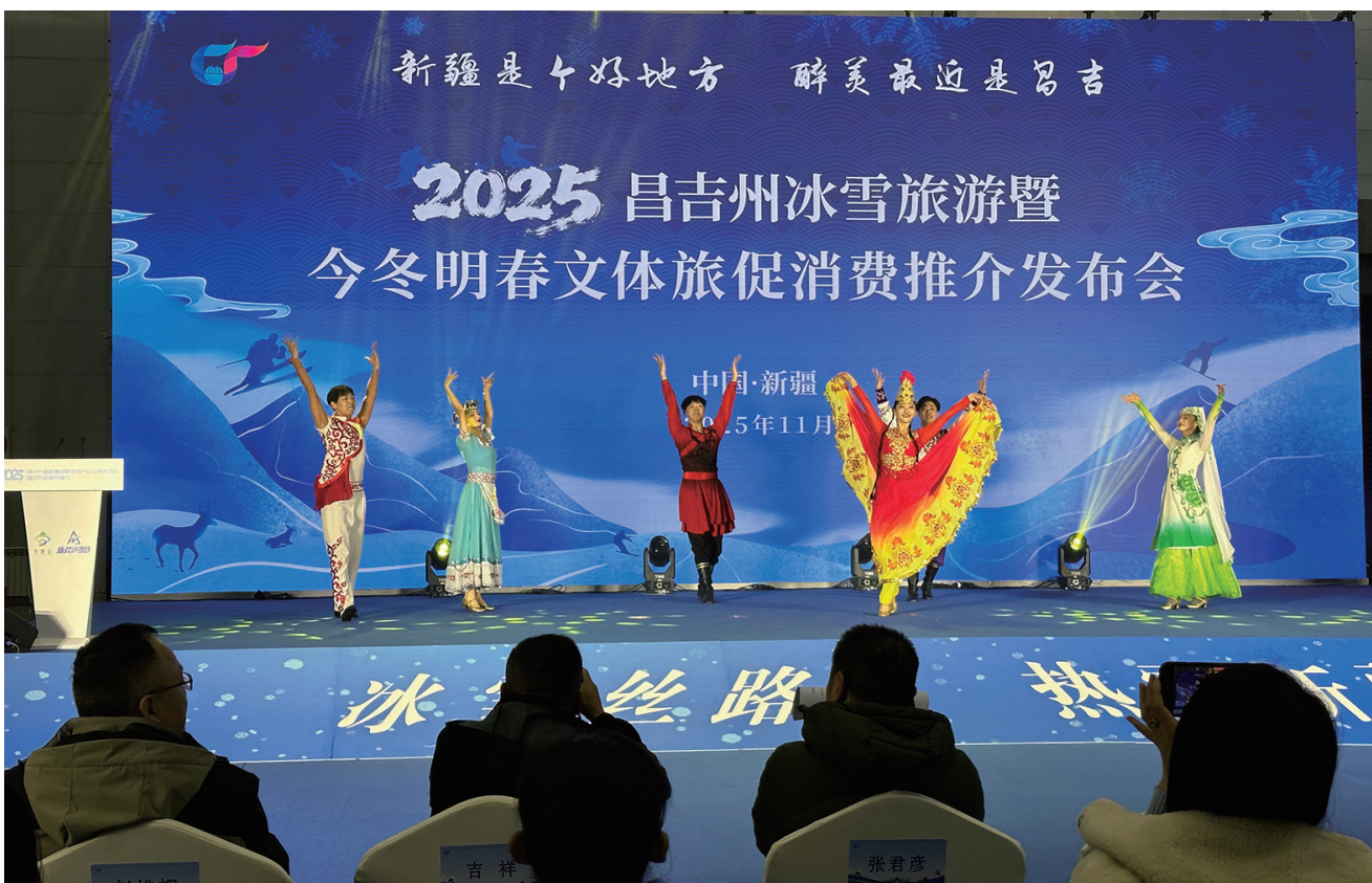
11月15日，在2025昌吉州冰雪旅游暨今冬明春文体旅促消费推介发布会上，演员们进行歌舞表演。