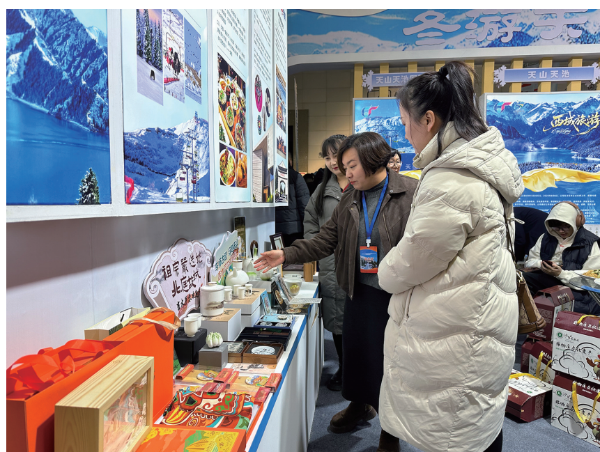
昌吉州展厅内，参展商正在给游客介绍文创产品。