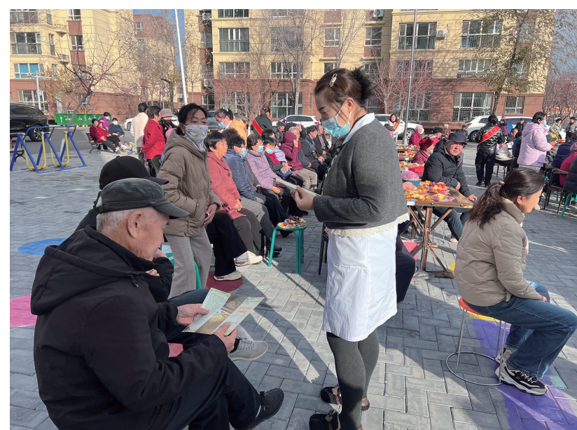
近日，在吉木萨尔县吉木萨尔镇苇湖巷社区，社区卫生服务站医护人员为居民讲解糖尿病防治知识。