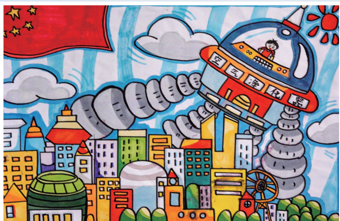
《空气净化器》 马克笔画