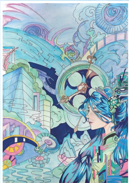
《异星宇航·迷幻征程》