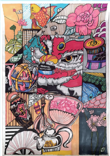
《民俗万象·艺韵凝彩》