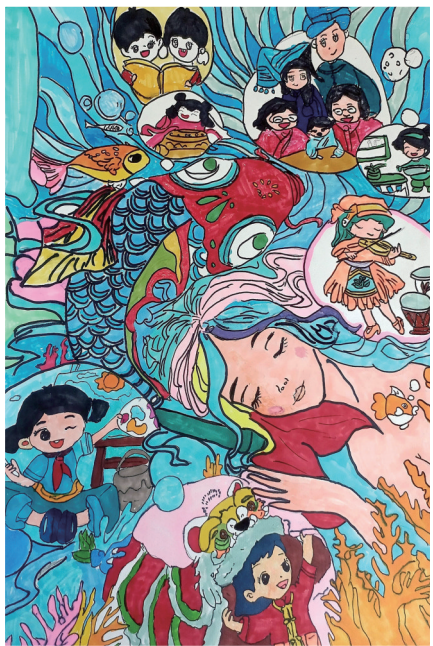
《乘科技之舟·掌时间之钥》