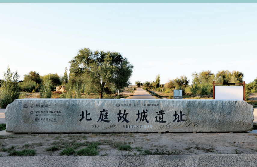
北庭故城遗址南门。