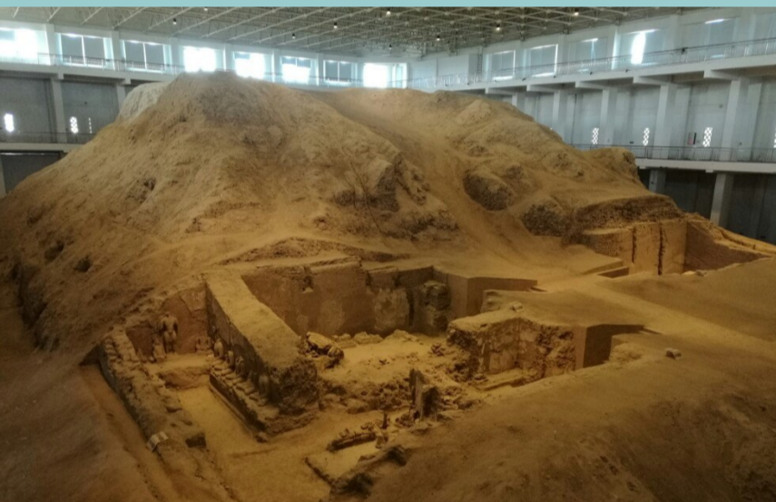
北庭高昌回鹘佛寺遗址。

北庭高昌回鹘佛寺遗址位于吉木萨尔县北庭故城遗址西面666米处，为高昌回鹘时期王家佛寺遗址。佛寺遗址平面呈长方形，南北残长70.5米，宽43.8米。佛寺遗址保存比较完整，现存大量塑像、壁画、回鹘文、汉文题记等，壁画绚丽多彩，其中王者出行图最为精美；塑像栩栩如生，交脚菩萨像雕塑充分证明了佛教文化融合了中原、西域的文化元素。回鹘文、汉文题记丰富了回鹘文化内涵，对全面研究高昌回鹘佛教艺术、信仰演变、文字书法、服饰风俗等有很大促进作用。