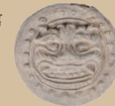
琉璃龙头残片（清代）