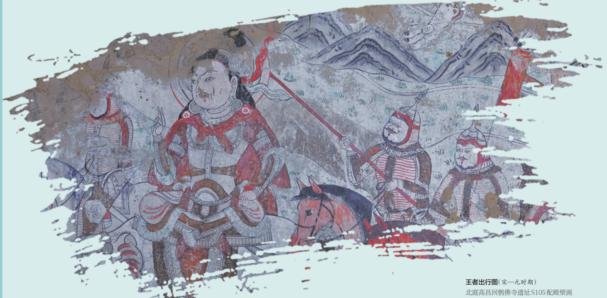
王者出行图（宋—元时期）