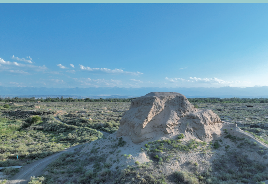
北庭故城遗址东敌台。