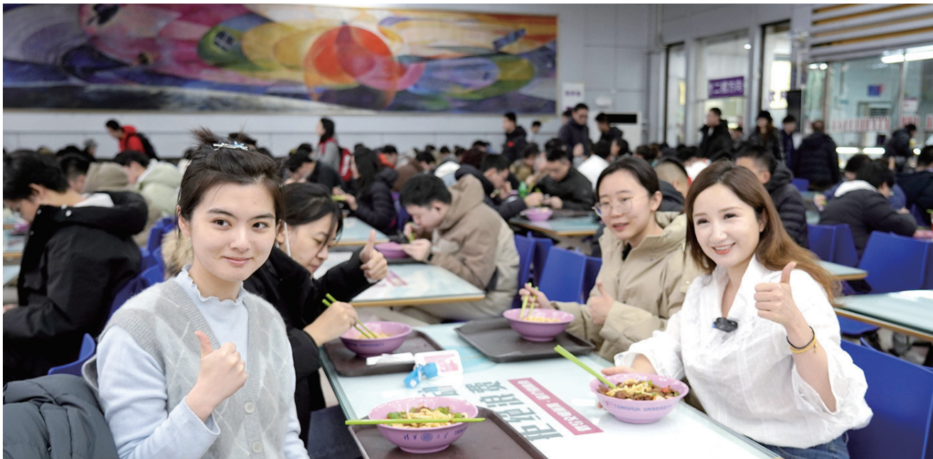
11月24日，奇台过油肉拌面走进清华大学，获得食客好评。

奇台县坐落于天山北麓，曾是丝绸之路新北道上重要的商贸重镇，享有“中国麦乡·天山麦海”的美誉。面粉筋道细腻、蛋白质含量高，是全国首个获国家农产品地理标志保护的面粉产品。