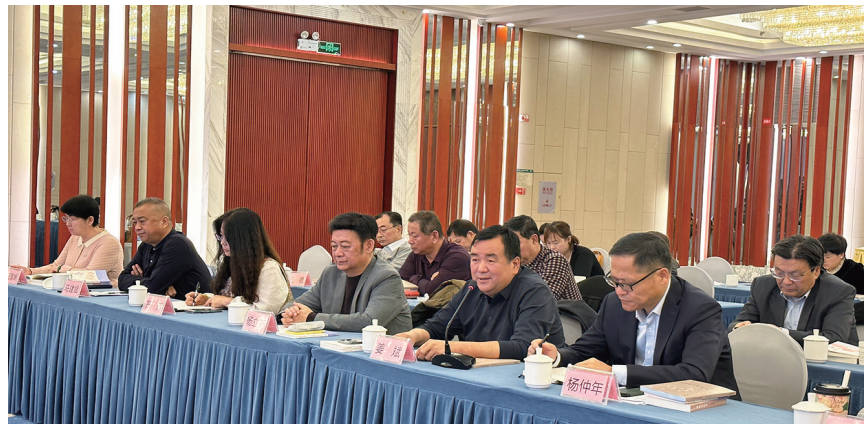
11月27日，“丝路昌吉”文学作品研讨会上，作者本人分享创作感悟。

城纪事》其实就是将玛纳斯及昌吉州的历史研究成果转化为文学作品，其中的每一段文字、每一个故事都凝聚着我的心血。” 近年来，昌吉州深入推进“文化润疆”，相继出台《文艺创作三年行动计划》《文艺扶持奖励办法》，连续举办8届“文艺腾飞奖”评选表彰工作，建立文学创作高层次工作室，有效激发了广大文艺工作者的创作热情，推动昌吉文学迈向新征程，涌现出一批扎根人民、反映时代的优秀作品。持续打造具有昌吉标识的文艺品牌，先后推出《博峰文丛》、“丝路昌吉”等品牌文学活动，多层次、多维度推动昌吉州文艺事业繁荣发展。