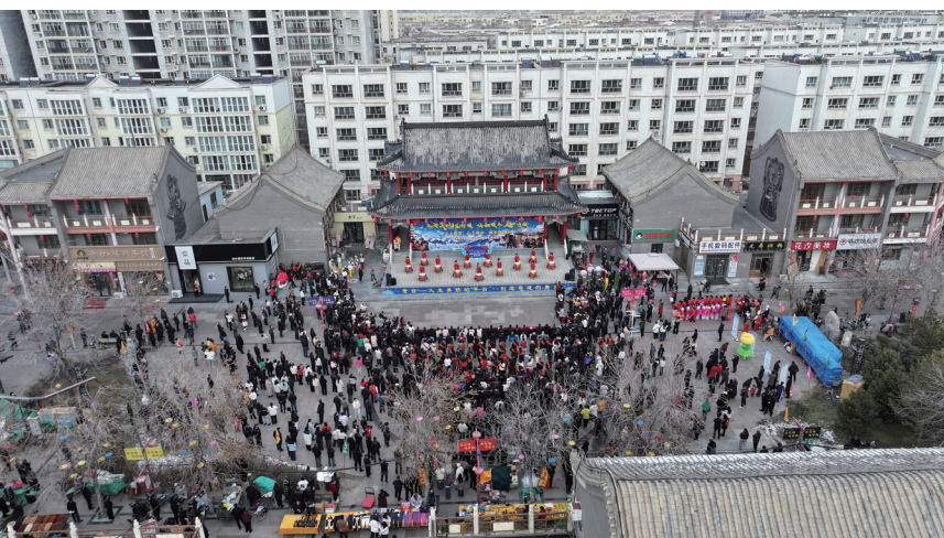
奇台县今冬明春“冰雪+”旅游季启动仪式。