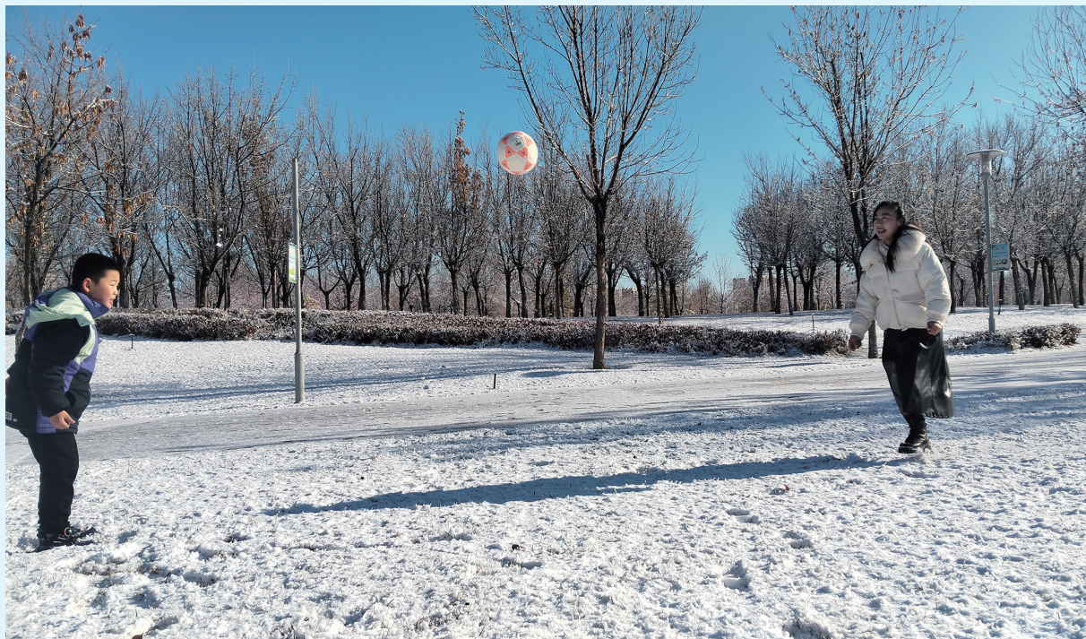
11月23日,雪后的昌吉市滨湖河景区中央公园,市民在雪地玩耍、踢足球。