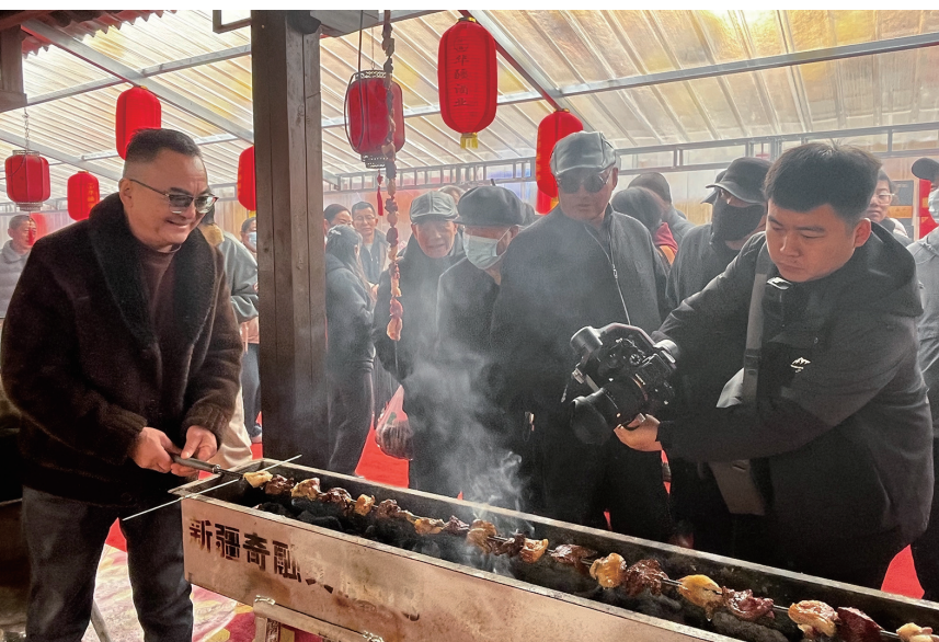
奇台县杨大拿一号黄面店创意推出的超大羊肉串。