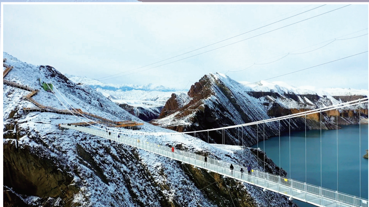
玛纳斯县肯斯瓦特景区的玻璃栈道吸引游客前来打卡。