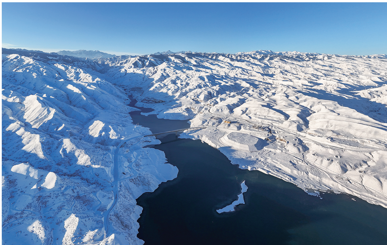
雪后的天山百里丹霞景区,赤壁天湖静卧其间,宛如一块碧玉。 □本报记者 陶维明摄