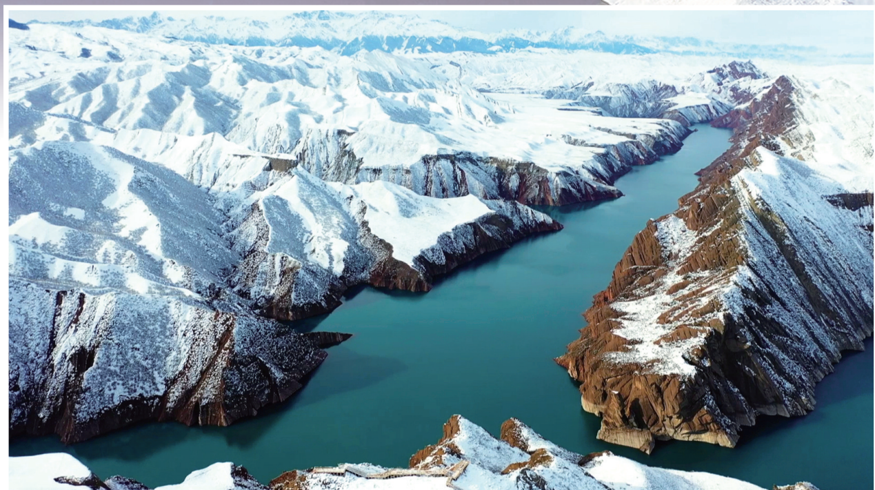
雪后的肯斯瓦特湖,碧蓝的湖水被群山环绕。 □苟彩霞摄