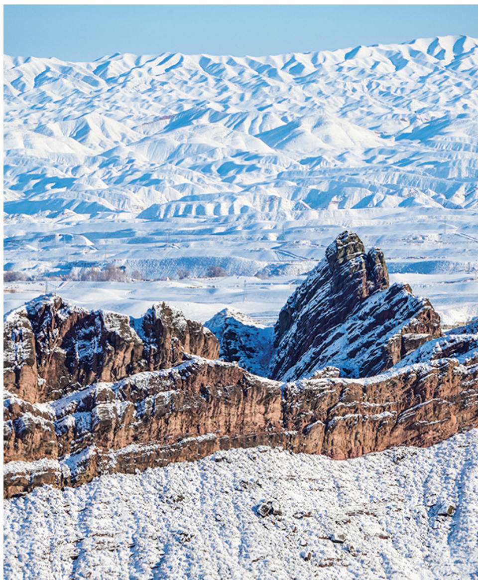
天山百里丹霞景区雪后初霁,披覆银装,犹如一幅水墨画。