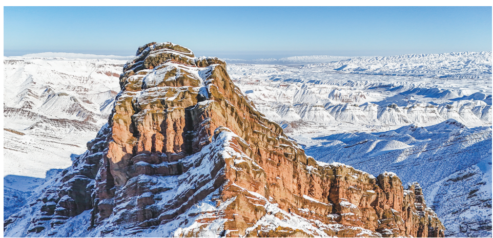
天山百里丹霞景区,百丈崖壁呈现出赭红、青蓝、草绿与淡黄交织的丰富色彩,构成一幅色彩鲜明、造型奇特的地质画卷。