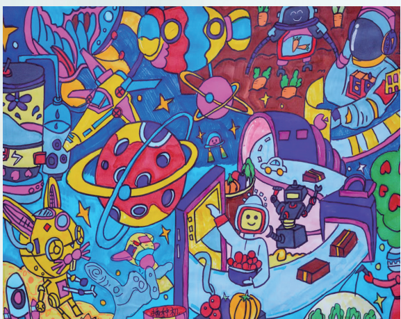
《未来世界太空生活》 马克笔画