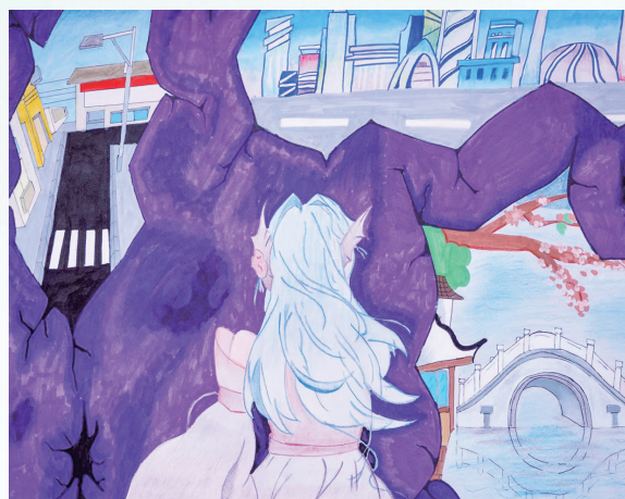
《穿越时空裂缝》 马克笔画