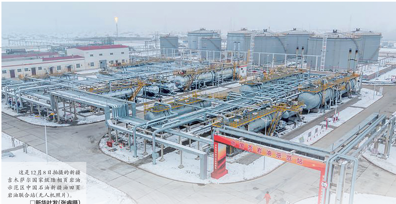
这是12月8日拍摄的新疆吉木萨尔国家级陆相页岩油示范区中国石油新疆油田页岩油联合站(无人机照片)。