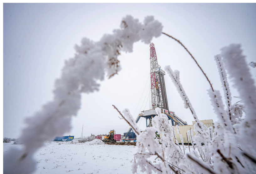
这是12月8日在新疆吉木萨尔国家级陆相页岩油示范区中国石油新疆油田页岩油JHW74-33井拍摄的作业现场。