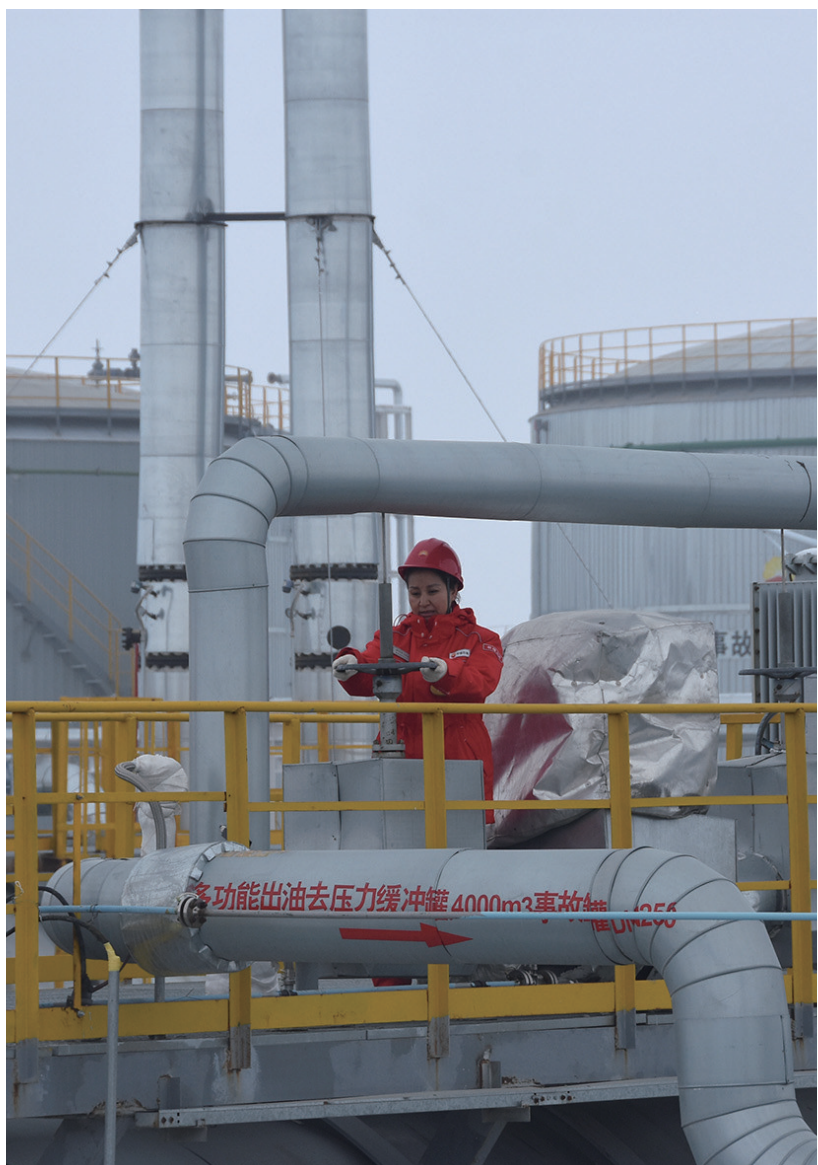
12月8日,在新疆吉木萨尔国家级陆相页岩油示范区,中国石油新疆油田页岩油联合站员工在巡检设备。