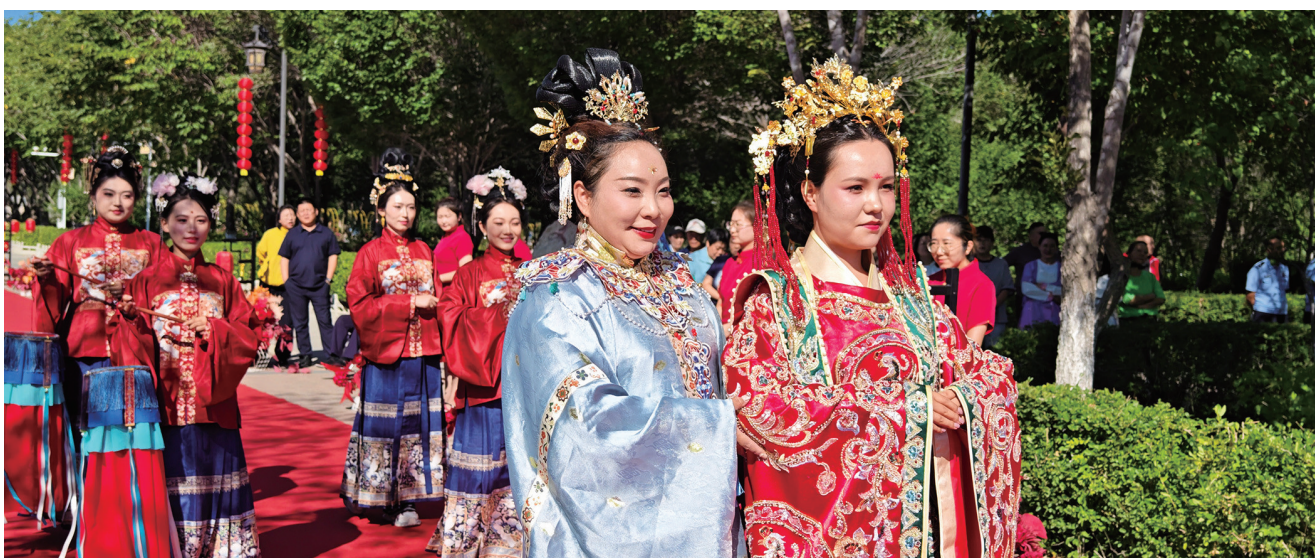
木垒县第三届新时代文明实践集体婚礼暨七夕节传统文化节日活动现场。

一人带动一群，一群温暖一城。秉持“群众在哪里，文明实践就到哪里”的理念，木垒县培育了木垒雷锋车队、马背宣讲队、白衣天使志愿服务队等18支品牌队伍，打造“暖心馒头幸福银龄”