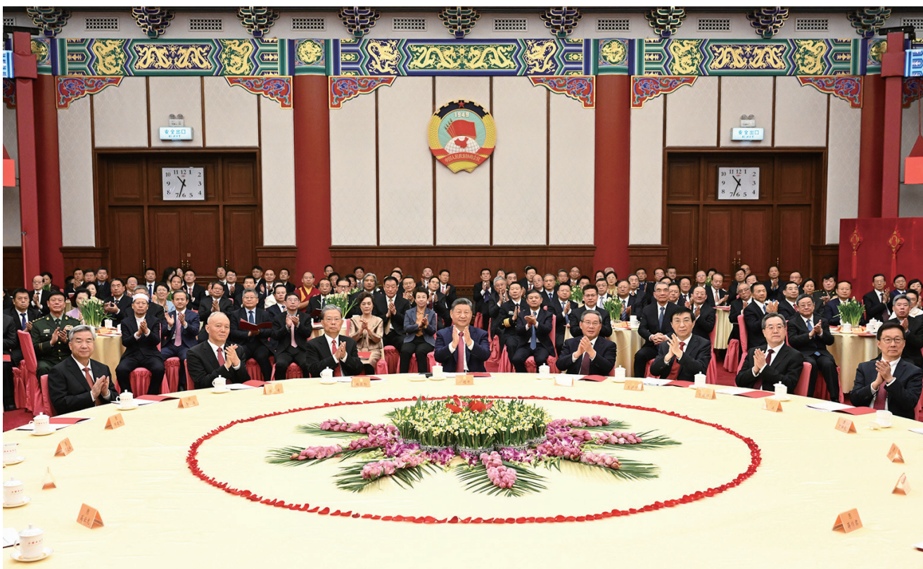
12月31日，全国政协在北京举行新年茶话会。党和国家领导人习近平、李强、赵乐际、王沪宁、蔡奇、丁薛祥、李希、韩正出席茶话会并观看演出。

习近平指出，2025年是很不平凡的一年。我们迎难而上、奋力拼搏，顺利完成经济社会发展主要目标，办了不少大事要事。我国经济顶压前行、向新向好发展，展现强大韧性和活力，改革开放迈出新步伐，民生保障更加有力，社会大局保持稳定。历经5年的艰苦奋斗，“十四五”圆满收官，我国经济实力、科技实力、国防实力、综合国力跃上新台阶。我们在砥砺奋进中进一步增强了志