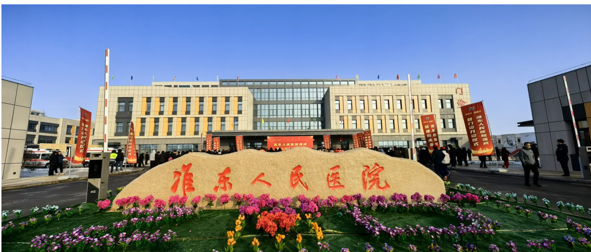
准东人民医院外景。