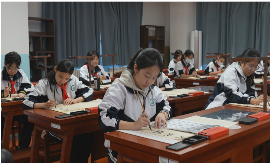
近日，在玛纳斯县第二中学，学生们在智慧书法教室学习书法。

为补齐牧区教育短板，玛纳斯县重点聚焦师资与硬件建设。通过实施“青蓝工程”师徒结对、集团内轮岗交流、教研联动等措施，不断提升牧区教师的专业能力。2024年，塔西河哈萨克族乡