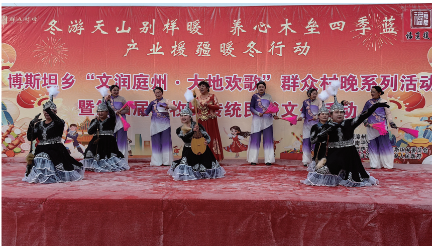
木垒县博斯坦乡2026年度“文润庭州·大地欢歌”群众村晚系列活动暨第四届农牧民传统文化活动文艺表演现场。