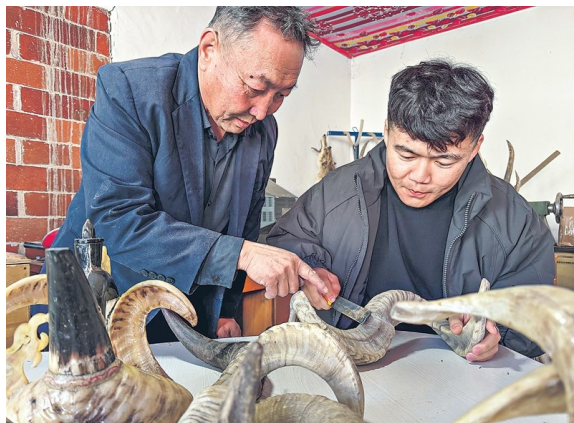
1月15日，对山指点徒弟制作骨雕作品。