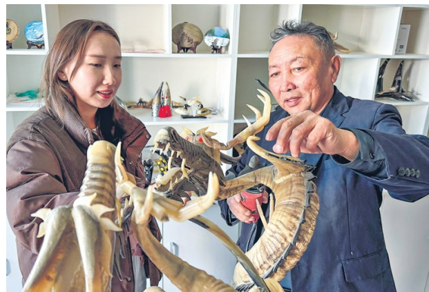
1月15日，对山给女儿讲解骨雕制作技巧。