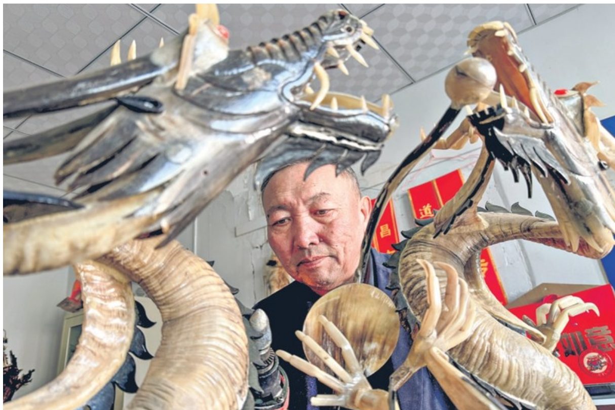
1月15日，对山打磨骨雕作品。