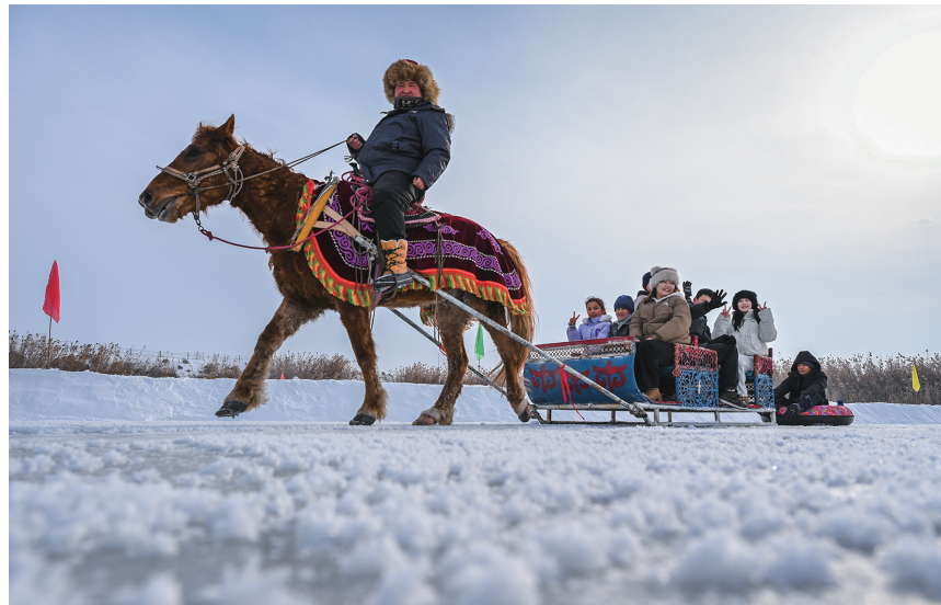
1月24日，呼图壁县五工台镇百泉湖冰雪乐园，游客在体验马拉爬犁。