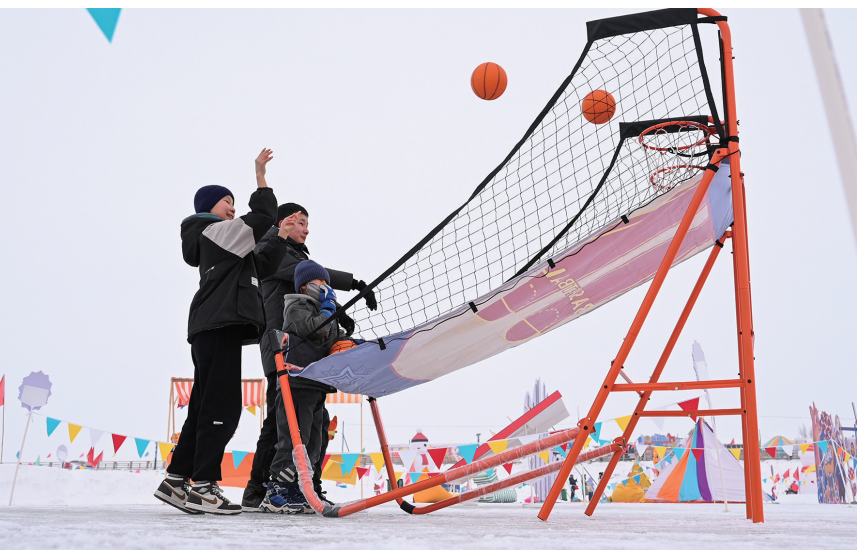
1月24日，呼图壁县五工台镇百泉湖冰雪乐园，小朋友在体验趣味投篮游戏。