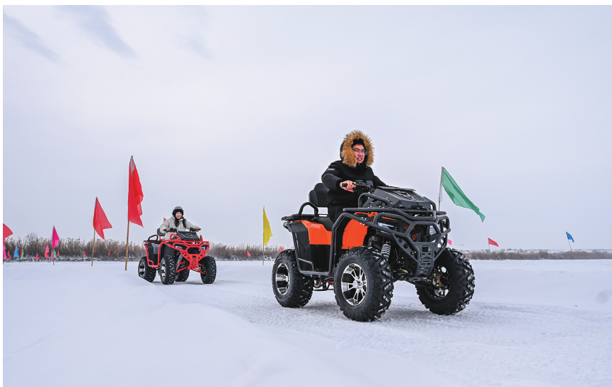
1月24日，呼图壁县五工台镇百泉湖冰雪乐园，游客在体验雪地摩托车。