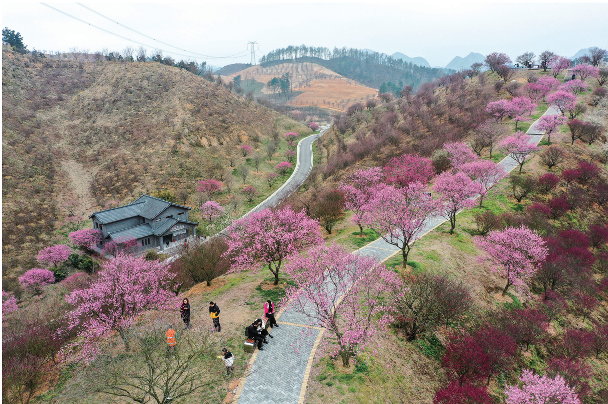
1月24日，远眺贵州梅园自然风光（无人机照片）。