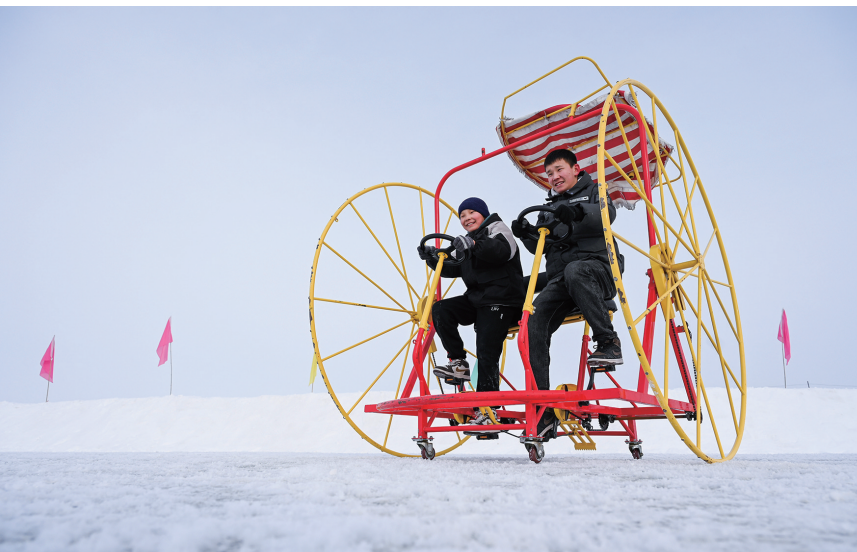
1月24日，呼图壁县五工台镇百泉湖冰雪乐园，游客在体验冰上自行车。