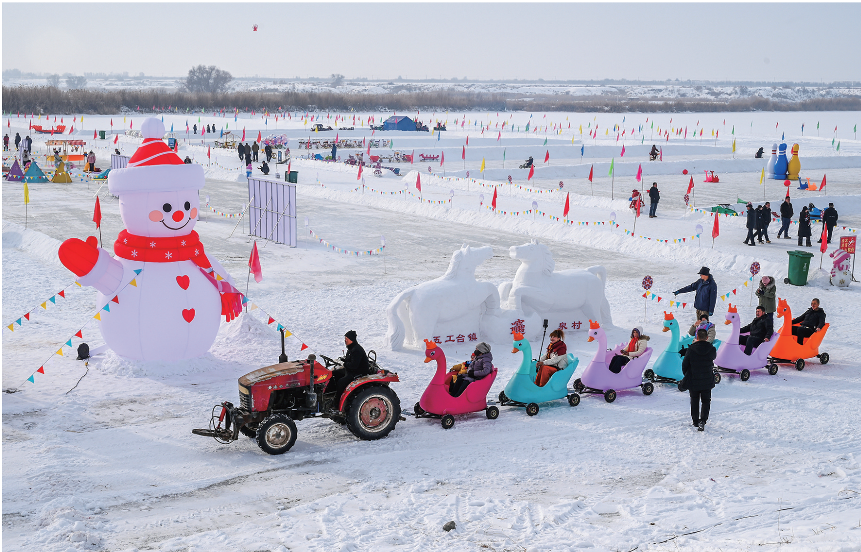
1月24日，呼图壁县五工台镇百泉湖冰雪乐园，游客正在体验“拖拉小火车”项目。

1月24日，呼图壁县五工台镇百泉湖冰雪乐园开园试运营。游客们赏雪雕，体验马拉爬犁、雪地摩托车、冰上自行车等特色项目，在欢声笑语中感受冰雪运动的激情与活力。