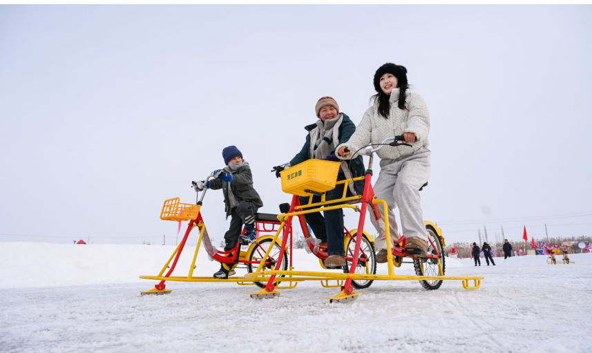
1月24日，呼图壁县五工台镇百泉湖冰雪乐园，游客在体验冰上自行车。